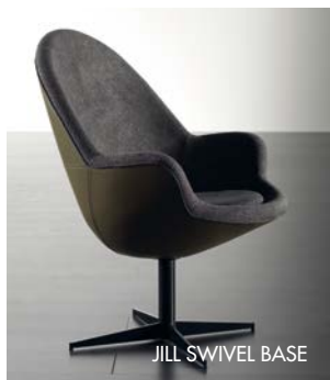
JILL SWIVEL BASE