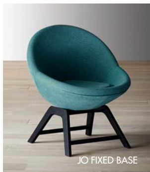
JO FIXED BASE