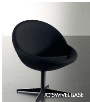
JO SWIVEL BASE