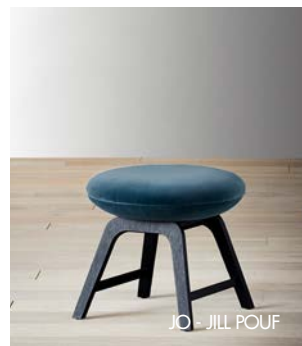
JO - JILL POUF

JO · poltroncina imbottita non sfoderabile · struttura in poliuretano rigido realizzato a stampo · imbottitura in poliuretano a stampo categoria FR · basamento: girevole in metallo vernishato nero opaco fisso in rovere tinto - vedi campionario