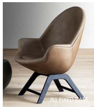
JILL FIXED BASE