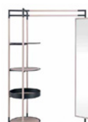
Bak Mirror FG 440.01