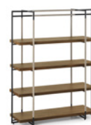
Bak Bookcase FG 440.10