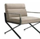
Sahrai L FG 471.00