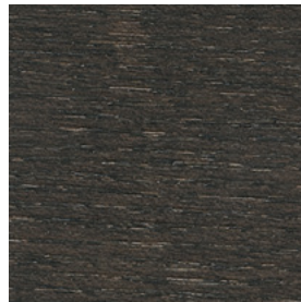
HK Grigio Plumbeo \ Dark Grey