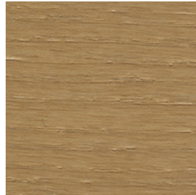
SG Anilina Beige \ Beige Aniline