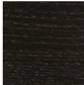
HL Wengé \ Wengé