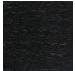
HP Carbone \ Carbon