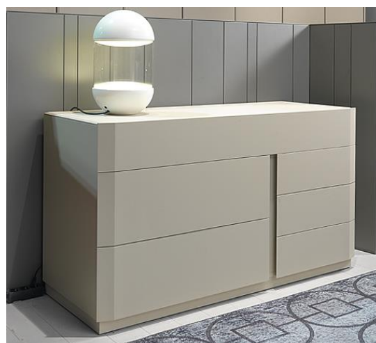
design Pierangelo Sciuto