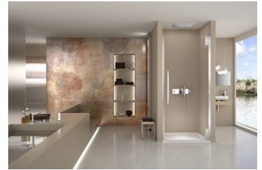
Рисунок 6PT L