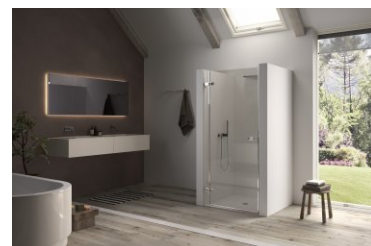
Рисунки: VTN1 L