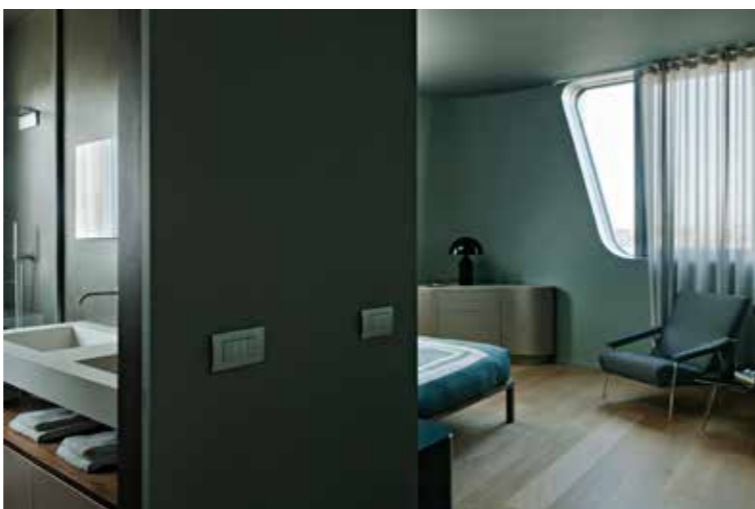
Huashan Apartment Shanghai