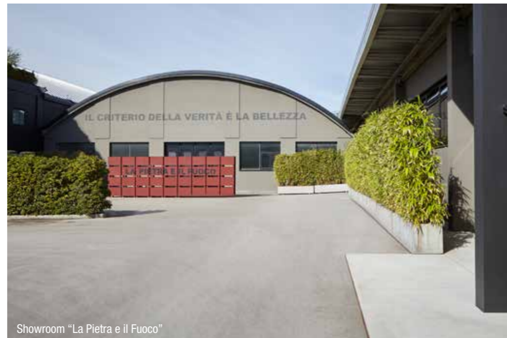
Showroom "La Pietra e il Fuoco"