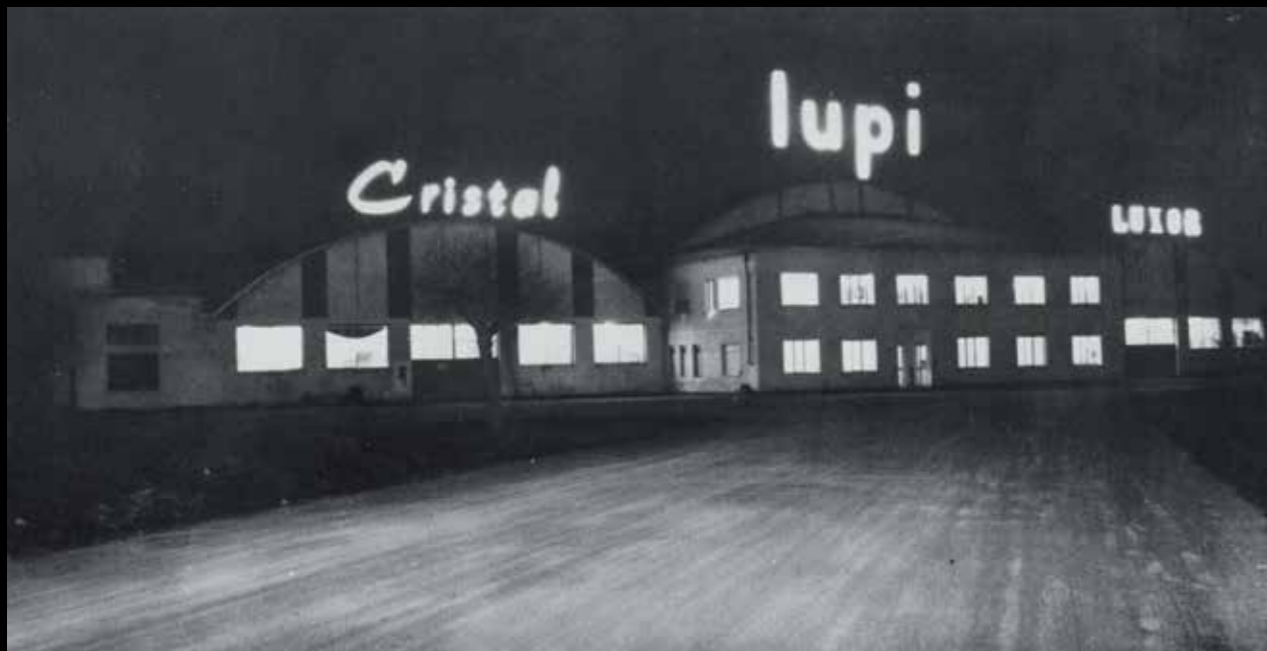
La Crystal Lupi Luxor negli anni '60 / Crystal Lupi Luxor in the 60's