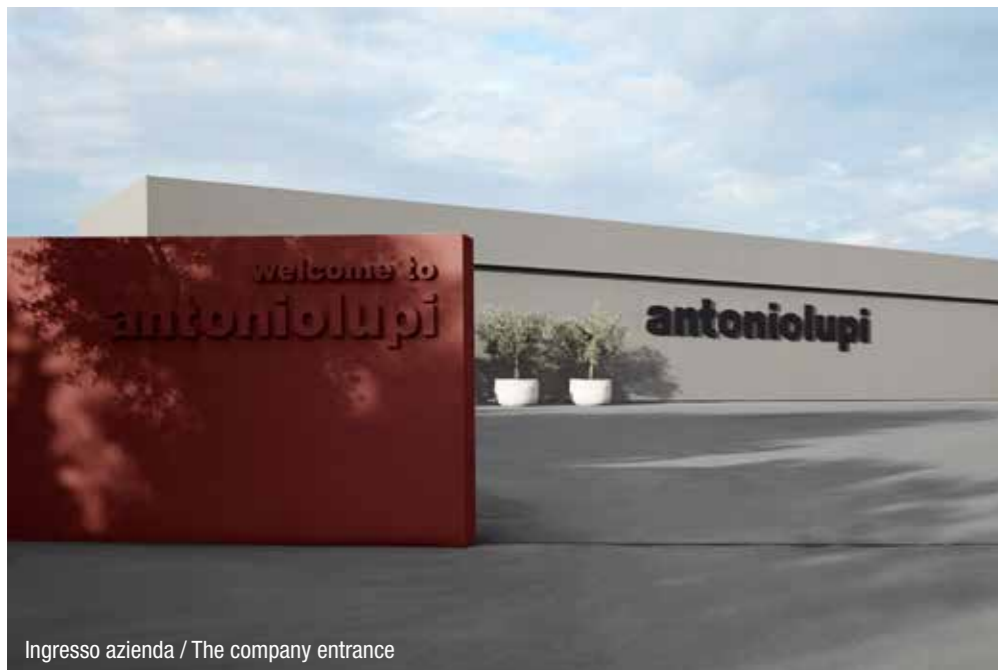
Ingresso azienda / The company entrance