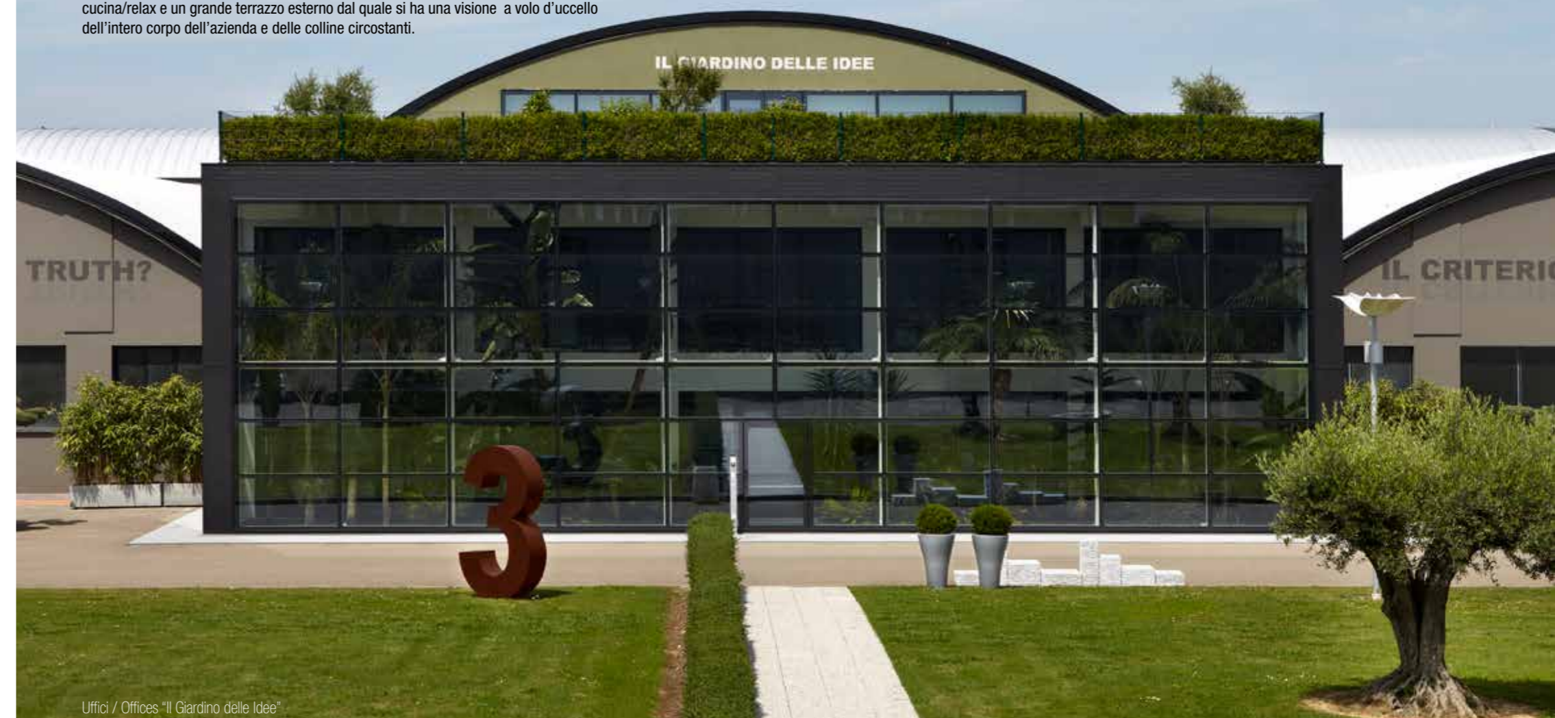
Uffici / Offices "Il Giardino delle Idee"

Il Giardino delle Idee is the name given to the new space that antoniolupi has built within the establishment to host the center of research, image and development. The new building resembles a glass nursery housing a tropical garden. Made from highly advanced technological material that allows perfect thermal insulation has three stories. On the ground floor two large meeting rooms and library / archive. The first floor is dedicated to brainstorming and operation activity with 18 workstations. On the last floor a kitchen and relaxation area with a large terrace that looks over the entire establishment.