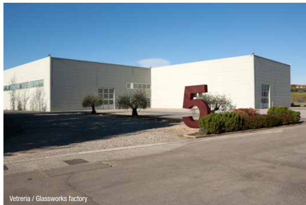
Vetreria / Glassworks factory

Il Giardino delle Idee è il nome del nuovo spazio che antoniolupi ha costruito all'interno della storica struttura aziendale per ospitare il proprio centro di ricerca, immagine e sviluppo. Affacciato su un prato verde delimitato da cipressi e da una siepe di osmantus, il nuovo edificio si presenta come una "scatola" di vetro che ospita un giardino tropicale. Realizzato con materiali tecnologicamente avanzati come le innovative lastre in vetro che garantiscono un perfetto isolamento termico pur mantenendo grande trasparenza, è strutturato su tre livelli. Al piano terreno sono ospitati due sale direzionali ed un locale archivio/biblioteca adatto ad ospitare ricercatori, designer e studenti. Al primo piano un grande open space che ospita una sala riunioni, la stanza del brainstorming, il posto dove confrontarsi, scambiarsi idee e opinioni, prendere decisioni operative, fissare tempistiche e strategie e la zona operativa vera e propria con diciotto postazioni previste. Al secondo piano una zona cucina/relax e un grande terrazzo esterno dal quale si ha una visione a volo d'uccello dell'intero corpo dell'azienda e delle colline circostanti.