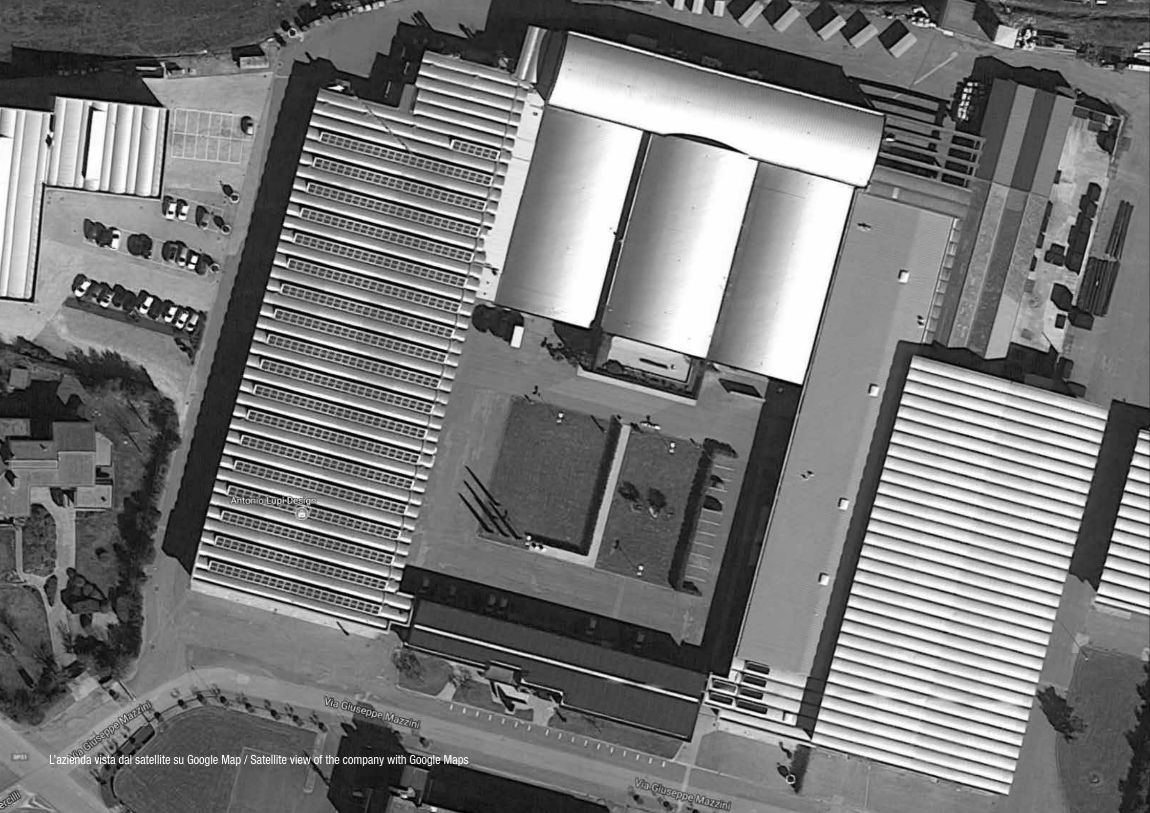
L'azienda vista dal satellite su Google Map / Satellite view of the company with Google Maps