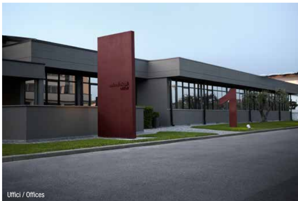
Uffici / Offices