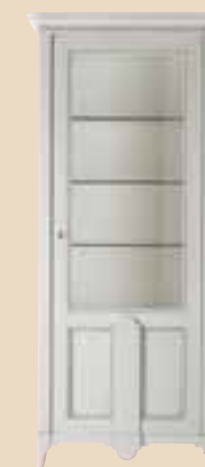
667 Vetrina 1 anta dx 1 door cabinet l. 90 p. 50 h. 202 50 Kg / 0,9 m 3