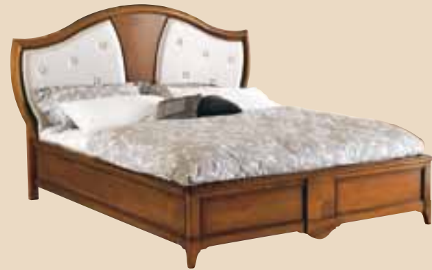
630 Letto matrimoniale con testata in pelle double bed with leather headboard l. 194 p. 212 h. 132 misura interna inside measurement 162x202 55 Kg / 1 m 3