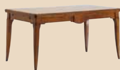
605 Tavolo rettangolare rectangular extending table l. 160 (aperto 50+50) p. 90 h. 79 75 Kg / 0,9 m 3