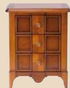
622 Comodino 3 cassetti 3 drawers bedside cabinet l. 56 p. 37 h. 70 15 Kg / 0,15 m 3