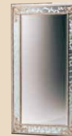
634 Specchiera / mirror l. 90 p. 5 h. 190 30 Kg / 0,1 m 3