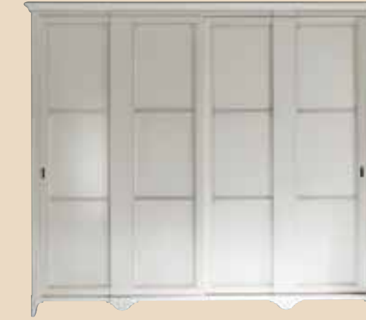
676 Armadio 2 ante scorrevoli wardrobe whit 2 sliding doors l. 290 p. 70 h. 250 155 Kg / 1,40 m 3