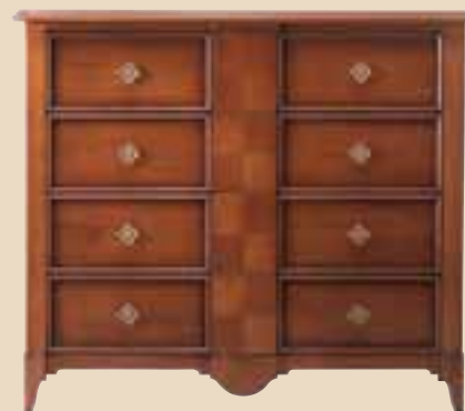
621 Comò 4 cassetti 4 drawers chest l. 130 p. 55 h. 114 65 Kg / 0,85 m 3