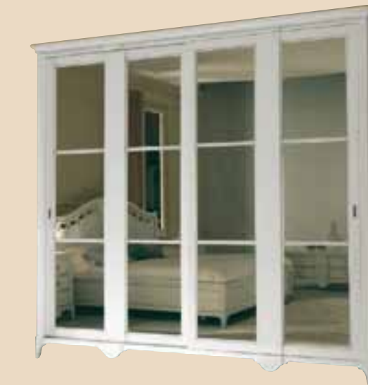
686 Armadio 2 ante scorrevoli con specchi wardrobe whit 2 sliding doors and mirrors l. 290 p. 70 h. 250 160 Kg / 1,40 m 3