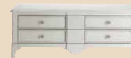
677 Base porta TV con cassetti TV element whit drawers l. 137 p. 55 h. 55 50 Kg / 0,45 m 3