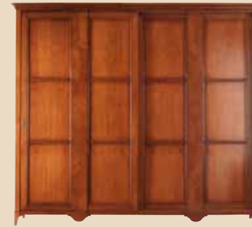
626 Armadio 2 ante scorrevoli wardrobe whit 2 sliding doors l. 290 p. 70 h. 250 155 Kg / 1,40 m 3