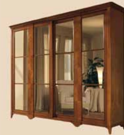
636 Armadio 2 ante scorrevoli con specchi wardrobe whit 2 sliding doors and mirrors l. 290 p. 70 h. 250 160 Kg / 1,40 m 3