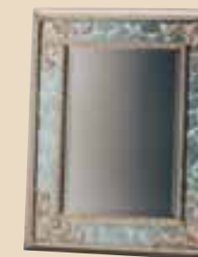
624 Specchiera / mirror l. 90 p. 5 h. 90 10 Kg / 0,05 m 3