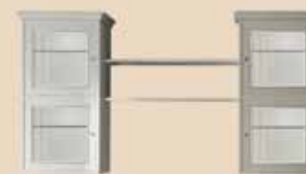
646 Soggiorno living room element l. 267 p. 55/42 h. 220 155 Kg / 1,20 m 3