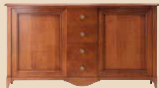
602 Credenza 2 ante 4 cassetti sideboard with 2 doors 4 drawers l. 205 p. 55 h. 114 85 Kg / 1,30 m 3