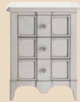
672 Comodino 3 cassetti 3 drawers bedside cabinet l. 56 p. 37 h. 70 15 Kg / 0,15 m 3