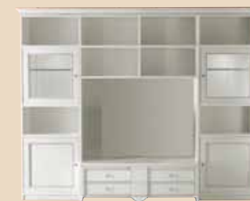
695 Soggiorno living room element l. 275 p. 55/42 h. 230 180 Kg / 1,30 m 3