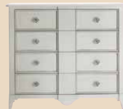
671 Comò 4 cassetti 4 drawers chest l. 130 p. 55 h. 114 65 Kg / 0,85 m 3