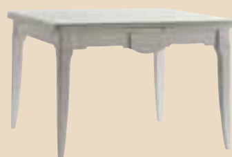
603 Tavolo quadrato allungabile square extending table l. 115 (aperto 50+50) p. 115 h. 79 55 Kg / 0,9 m 3