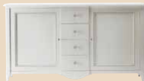
652 Credenza 2 ante 4 cassetti sideboard with 2 doors 4 drawers l. 205 p. 55 h. 114 85 Kg / 1,30 m 3