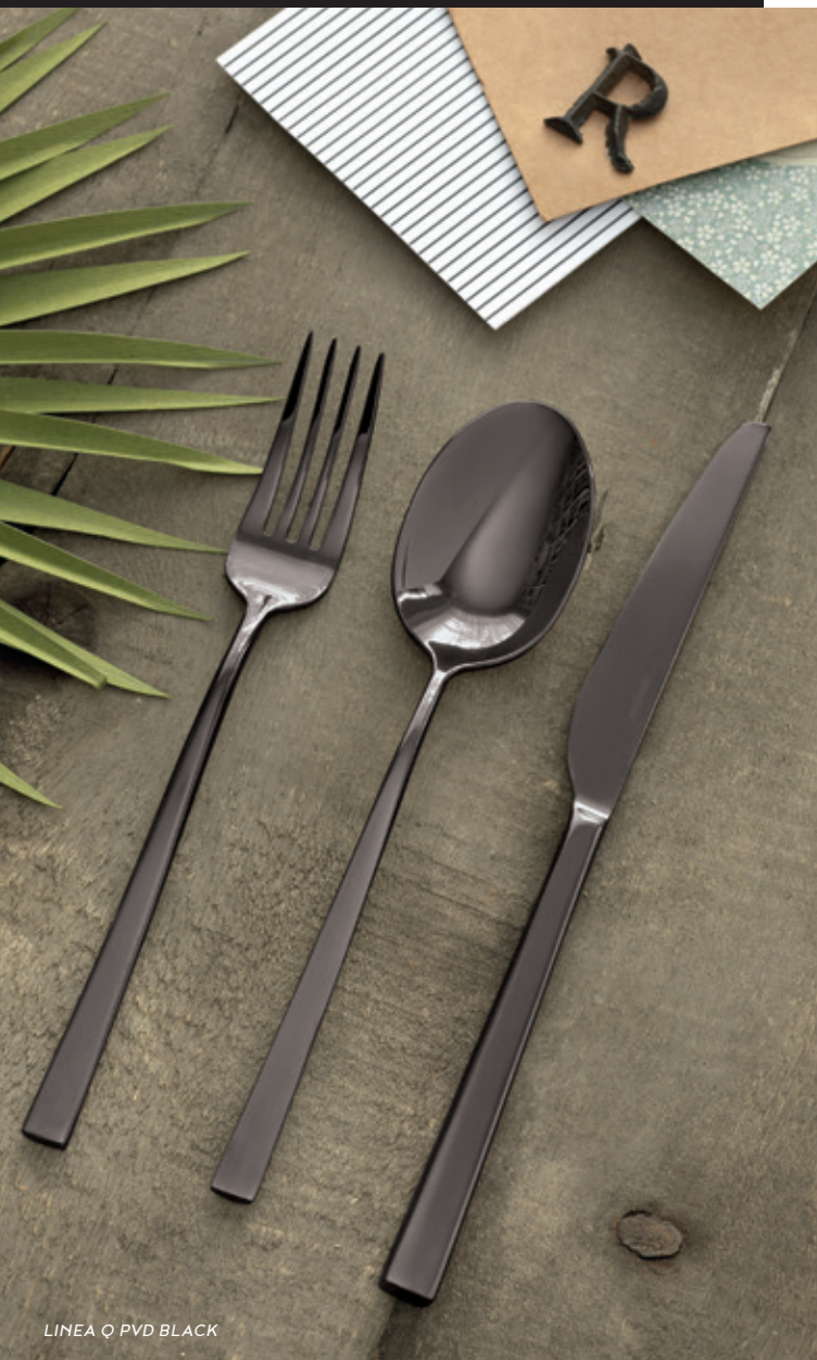
LINEA Q PVD BLACK