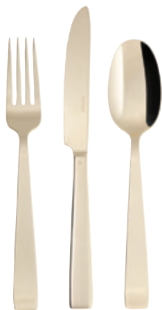
FLAT PVD CHAMPAGNE