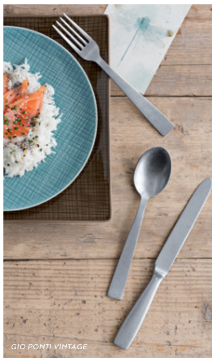
GIO PONTI VINTAGE