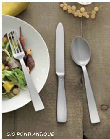
GIO PONTI ANTIQUE