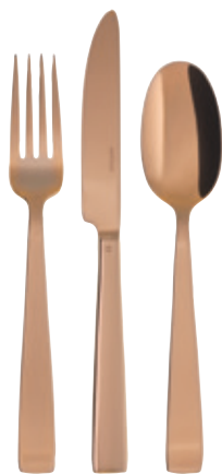
FLAT PVD COPPER