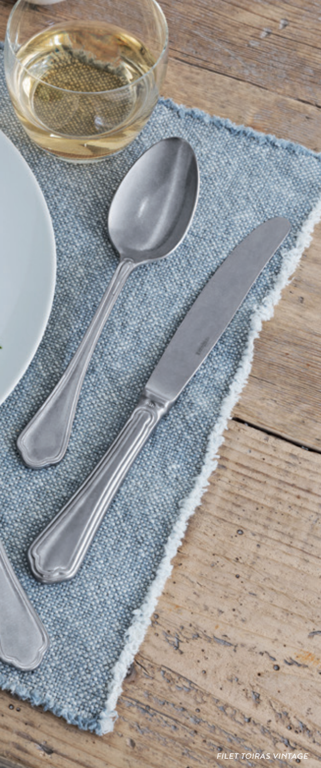
FILET TOIRAS VINTAGE