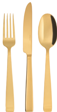
FLAT PVD GOLD