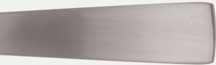
GIO PONTI SATIN

A differenza delle altre finiture, la satina dona un piacevole effetto visivo leggermente opaco pur conservando superfici lisce. Una scelta in armonia sia con il candore di piatti dal design moderno, sia con le variazioni decorative più disparate per una eleganza discreta ma al tempo stesso ricercata.