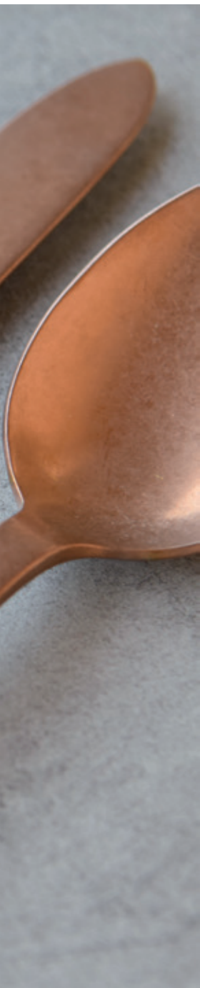
IMAGINE VINTAGE GOLD