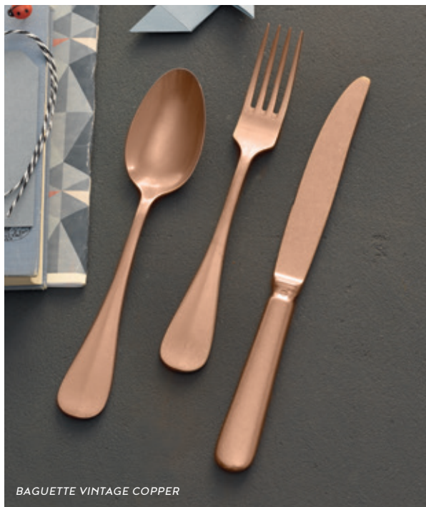
BAGUETTE VINTAGE COPPER