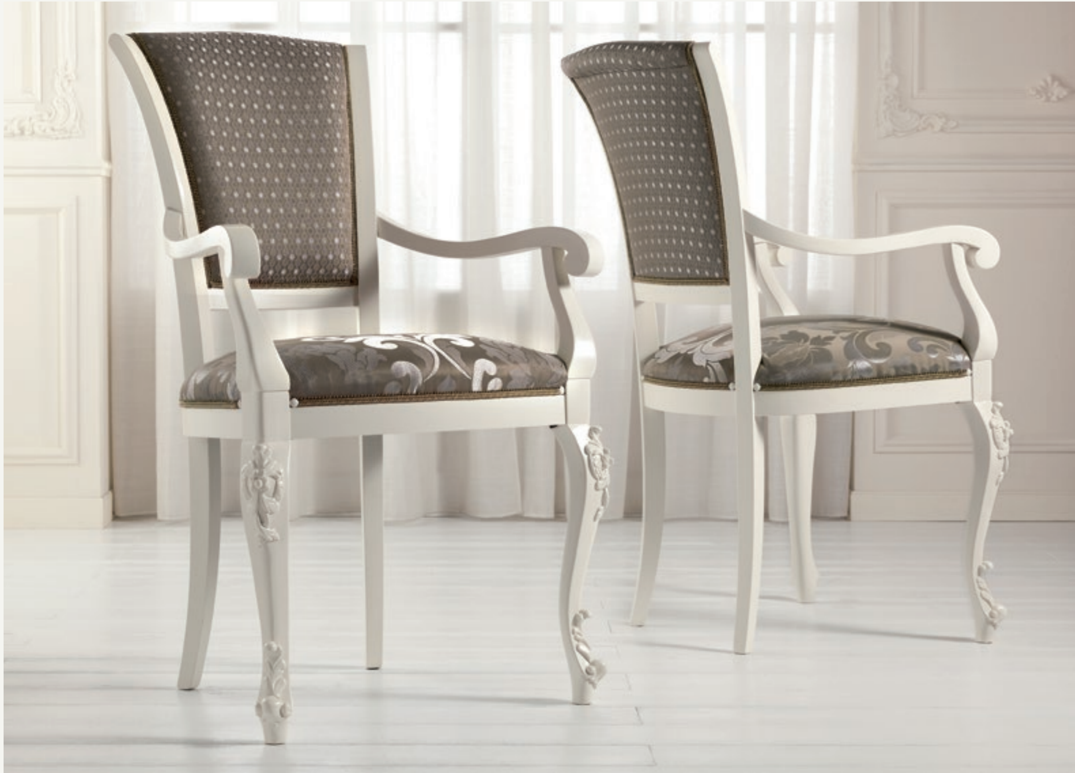
Art. 1005T - Sedia Capotavola / Armchair - 64 x 62 x 101H - tessuto / fabric "Rubino"