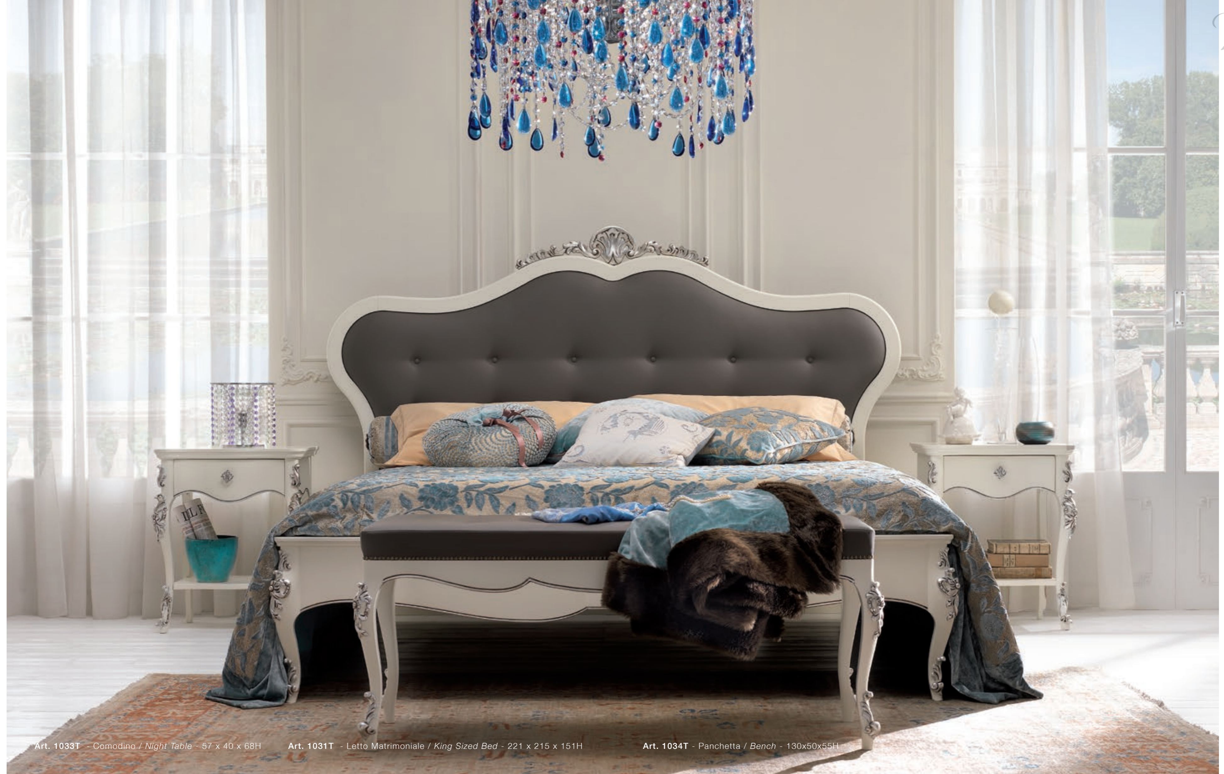
Art. 1033T - Comodino / Night Table - 57 x 40 x 68H