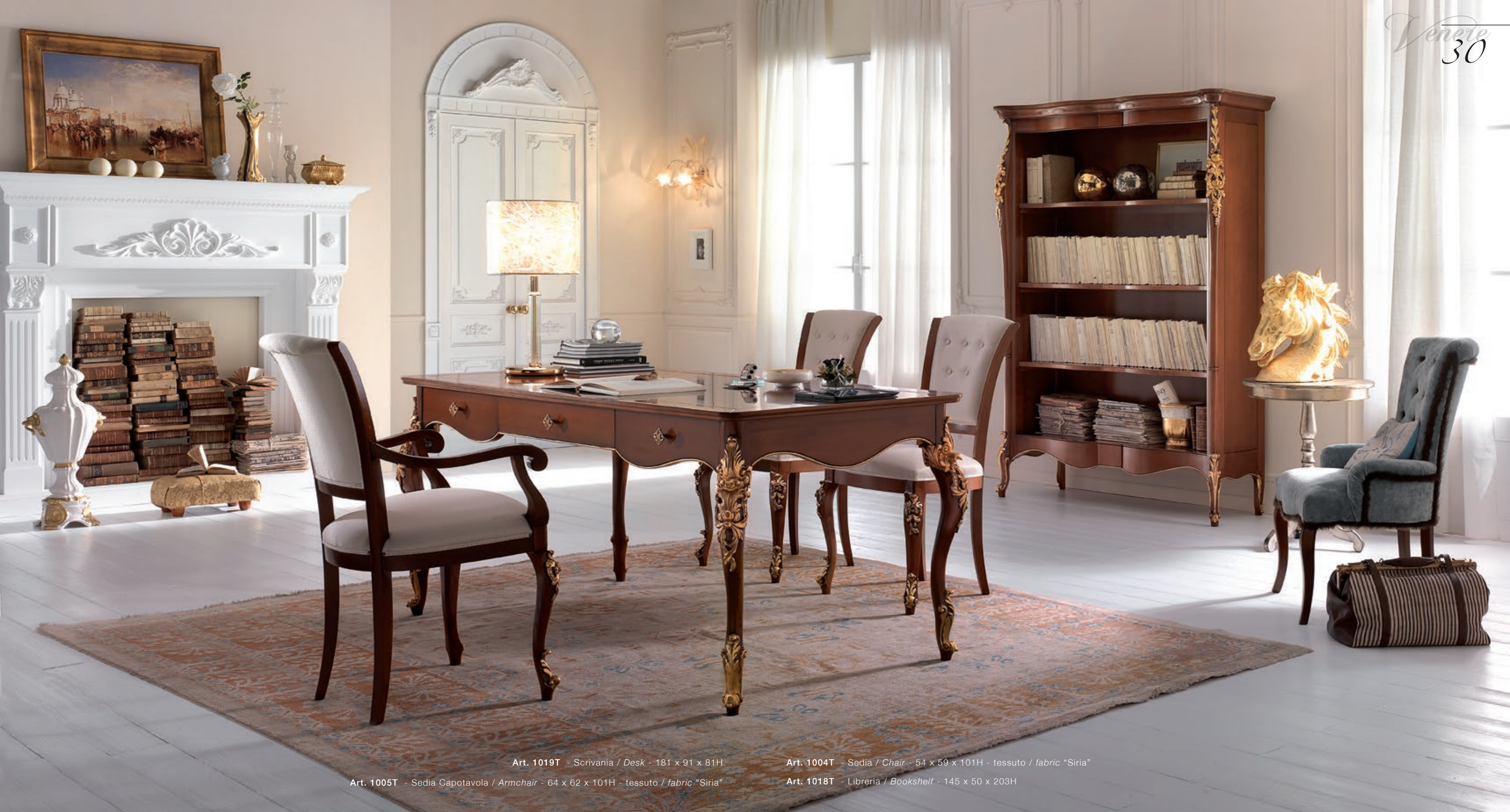
Art. 1019T - Scrivania / Desk - 181 x 91 x 81H