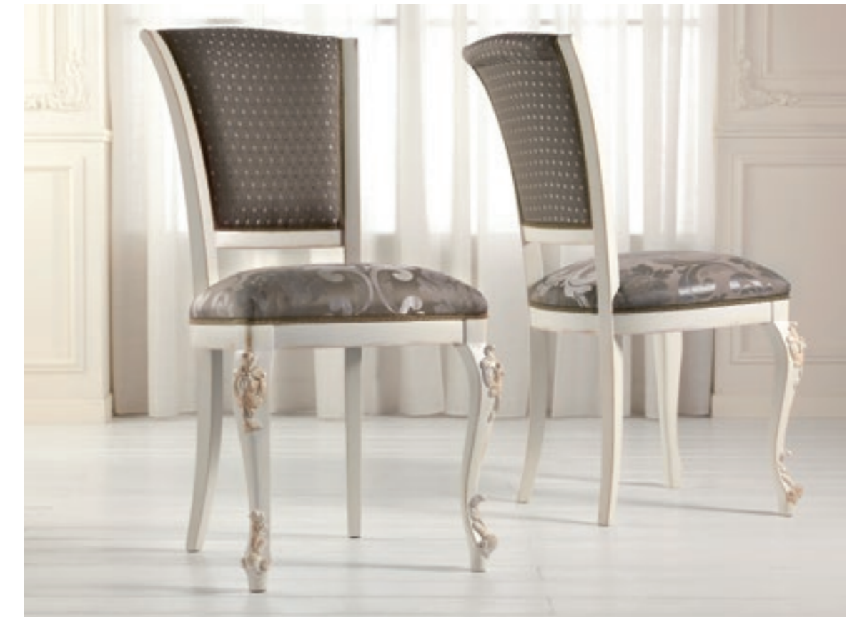
Art. 1004T - Sedia / Chair - 54 x 59 x 101H - tessuto / fabric "Rubino"