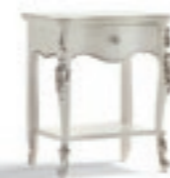
Art. 1033T Comodino Night Table 57 x 40 x 68H