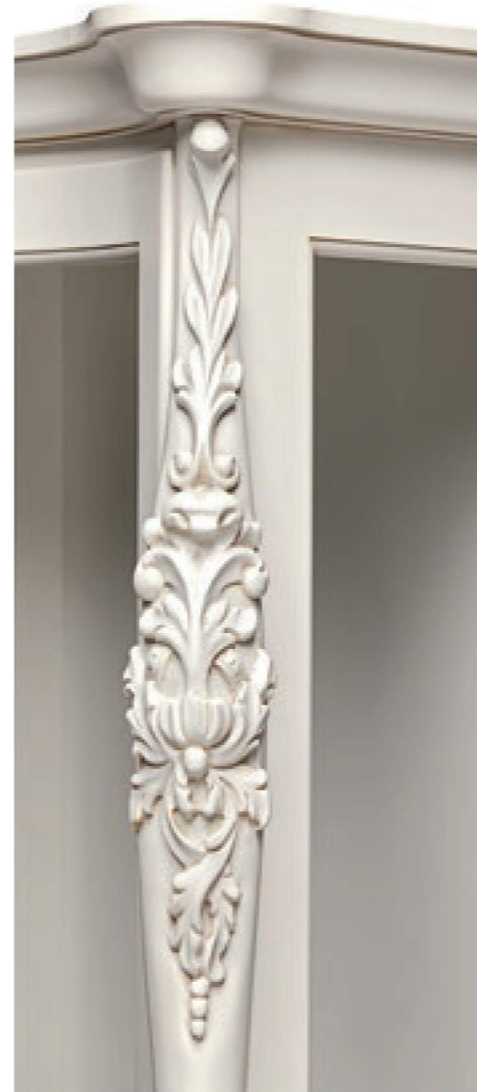
COD. 362 CAT. C GESSO PATINATO