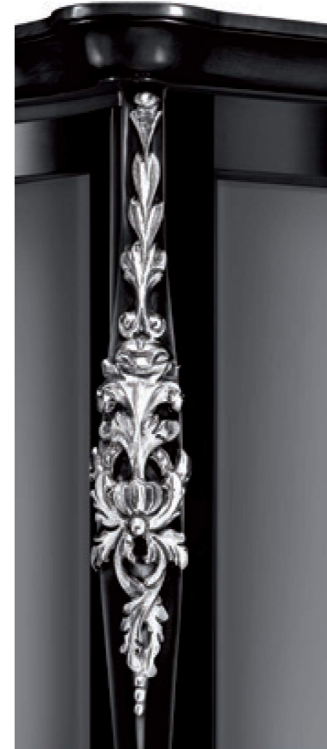
COD. 363 CAT. B+ NERO OPACO DETT. FOGLIA ARGENTO