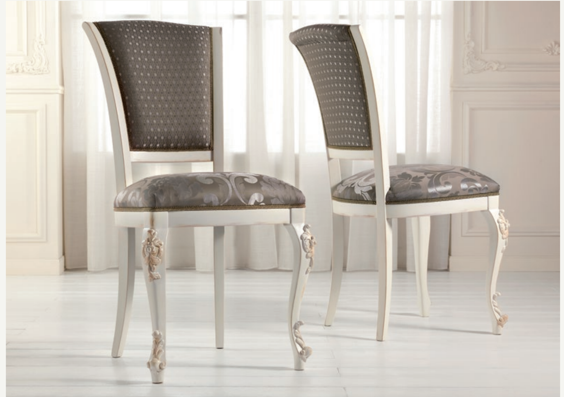
Art. 1004T - Sedia / Chair - 54 x 59 x 101H - tessuto / fabric "Rubino"