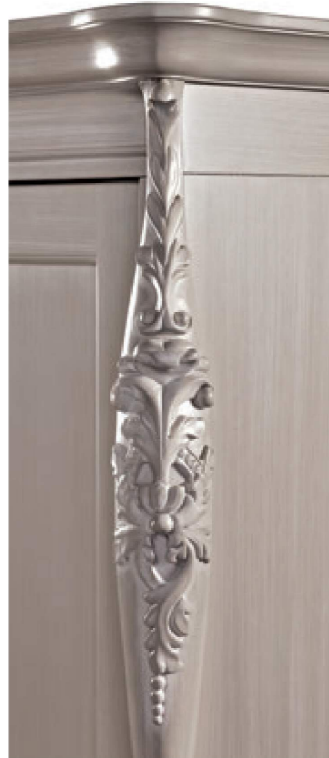
COD. 359 CAT. C CORDA DECAPATO