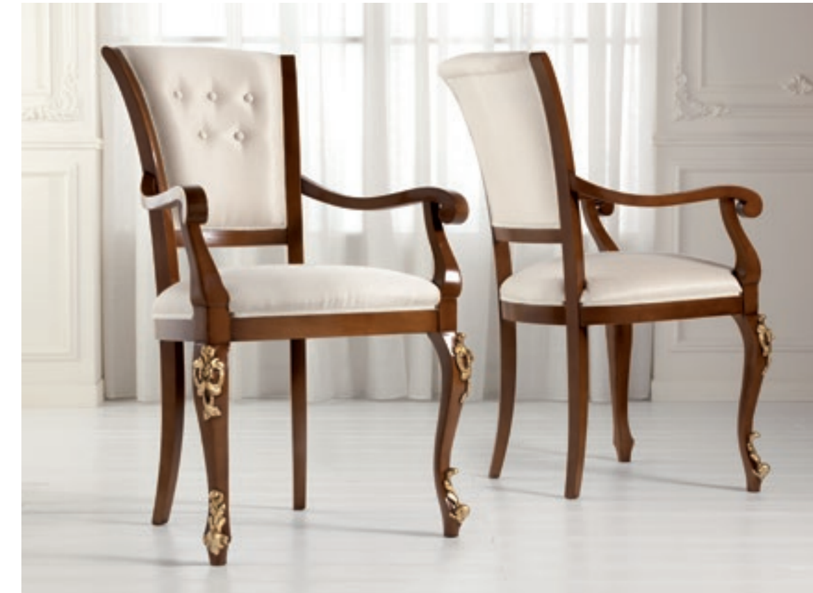
Art. 1005T - Sedia Capotavola / Armchair - 64x62x101H - tessuto/fabric "Siria"