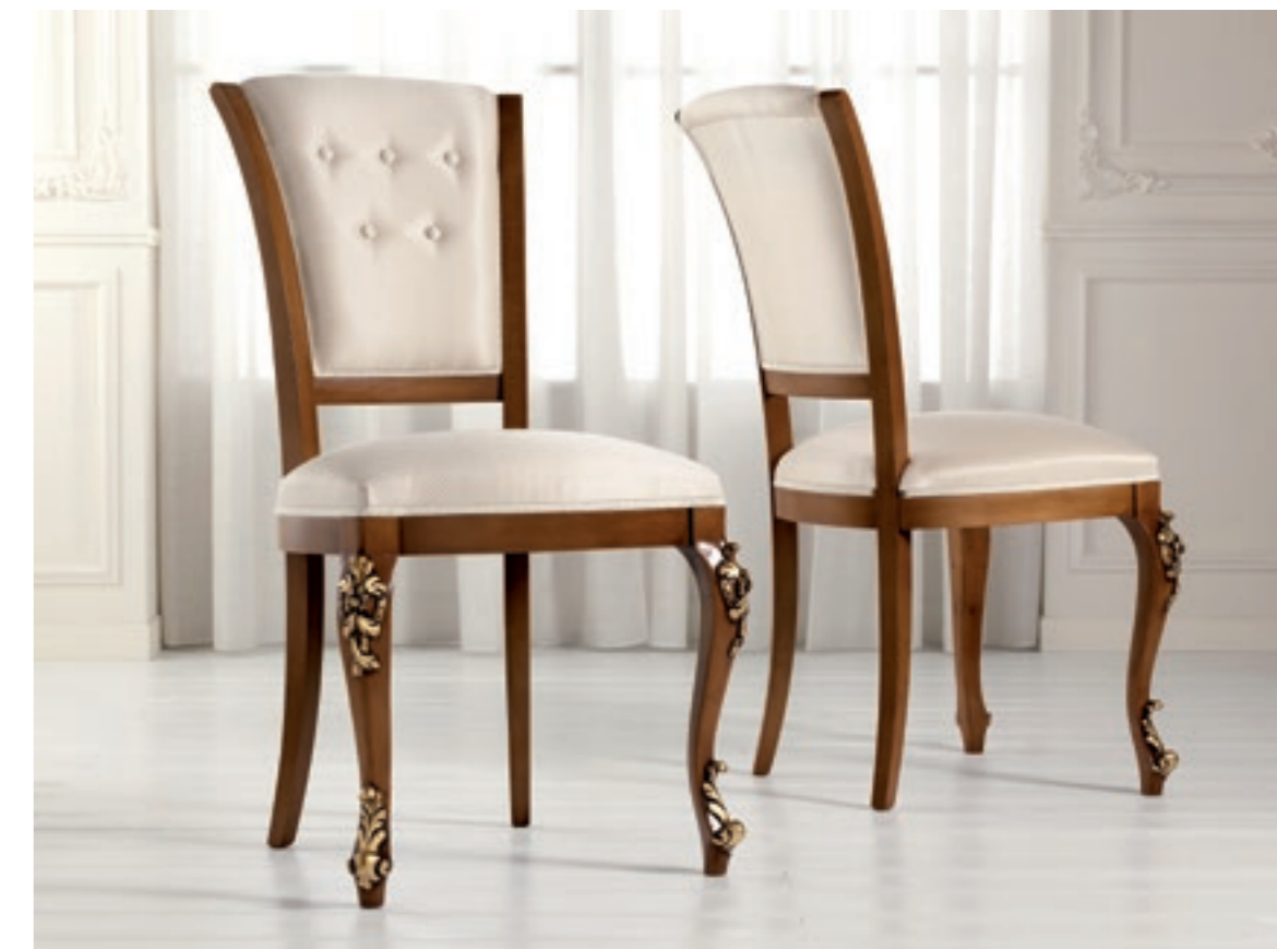
Art. 1004T - Sedia / Chair - 54x59x101H - tessuto / fabric "Siria"