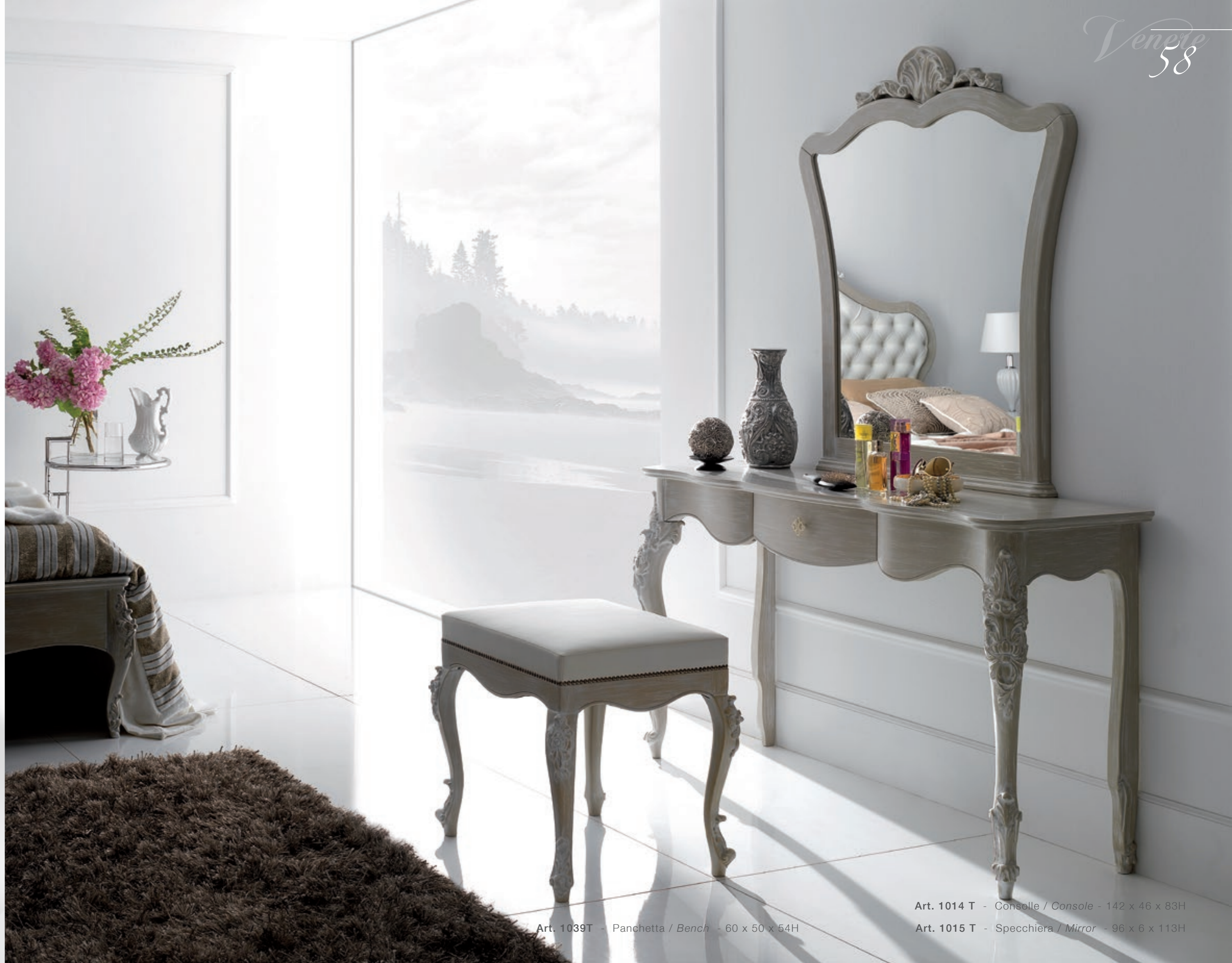
Art. 1039T - Panchetta / Bench - 60 x 50 x 54H