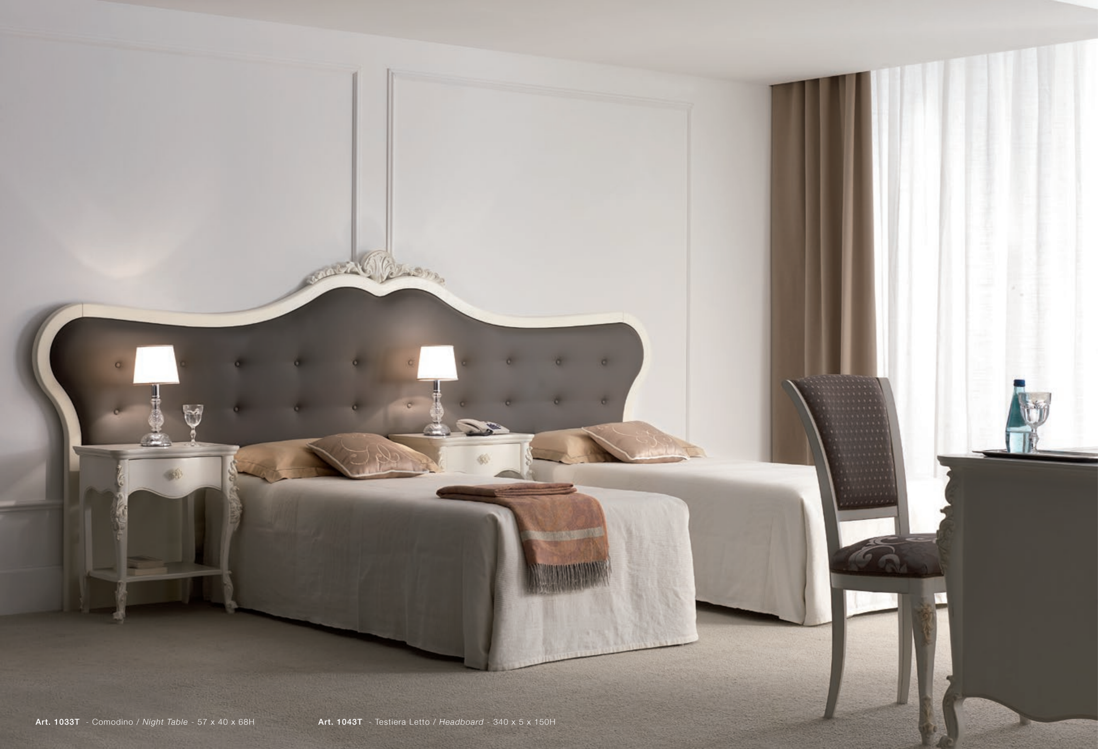
Art. 1033T - Comodino / Night Table - 57 x 40 x 68H