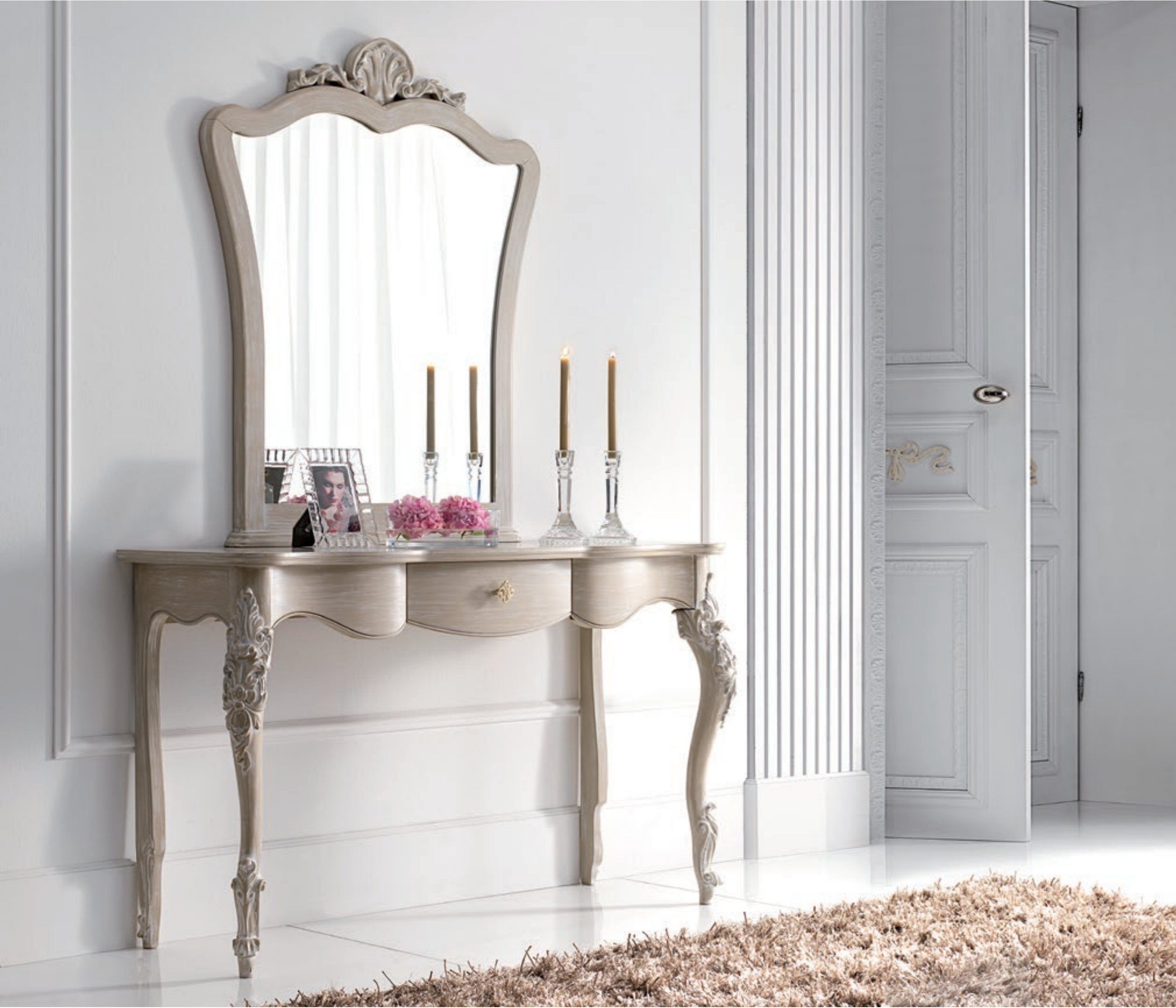
Art. 1014T - Consolle / Console - 142 x 46 x 83H