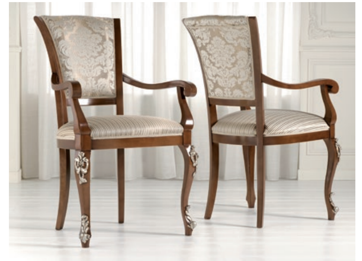
Art. 1005T - Sedia capotavola / Armchair - 64 x 62 x 101H - tessuto / fabric "Vienna"