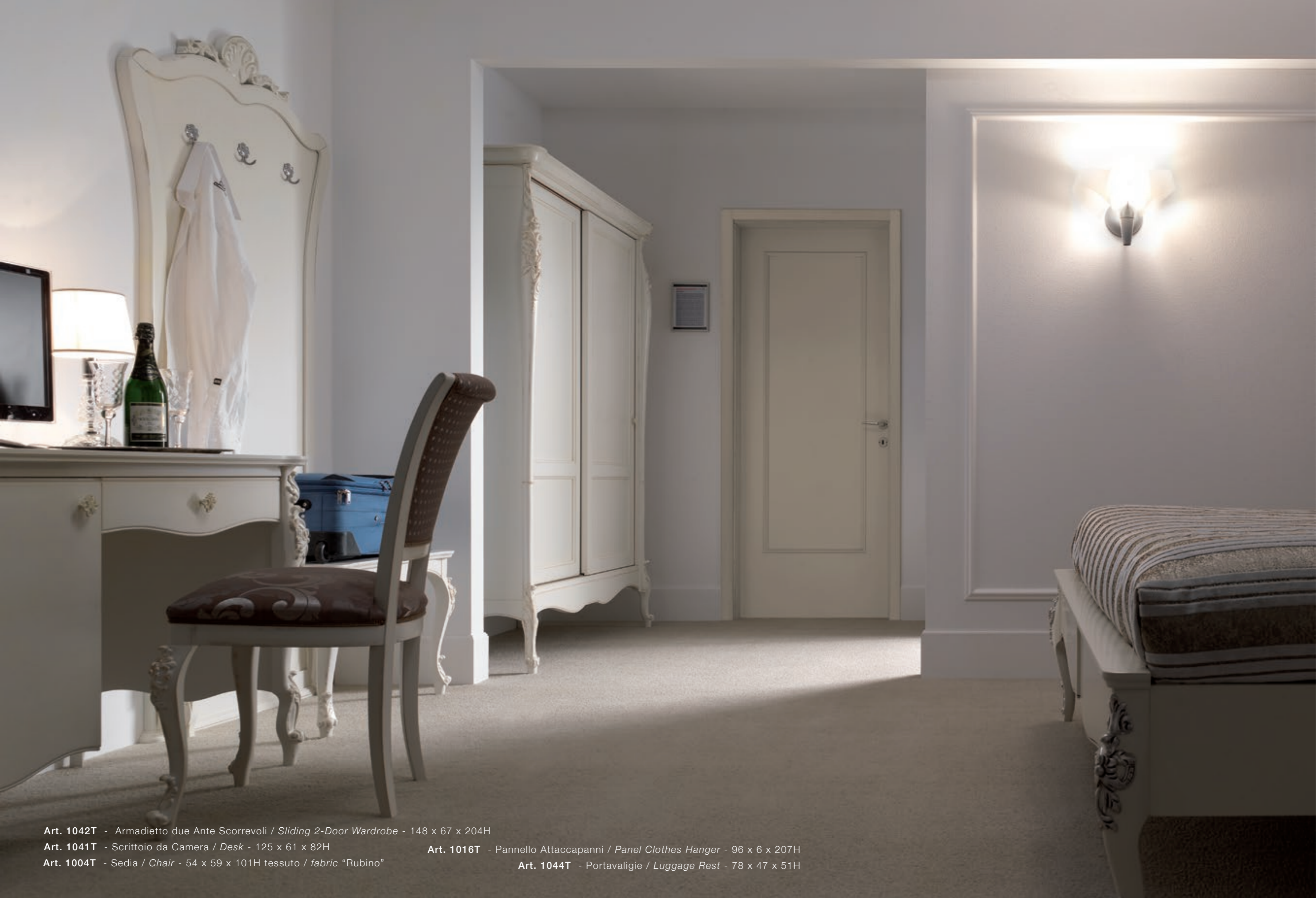
Art. 1042T - Armadietto due Ante Scorrevoli / Sliding 2-Door Wardrobe - 148 x 67 x 204H