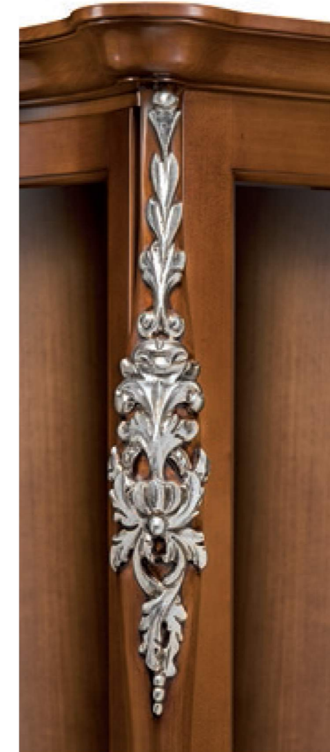
COD. 364 CAT. B+ NOCE FULVO DETT. FOGLIA ARGENTO