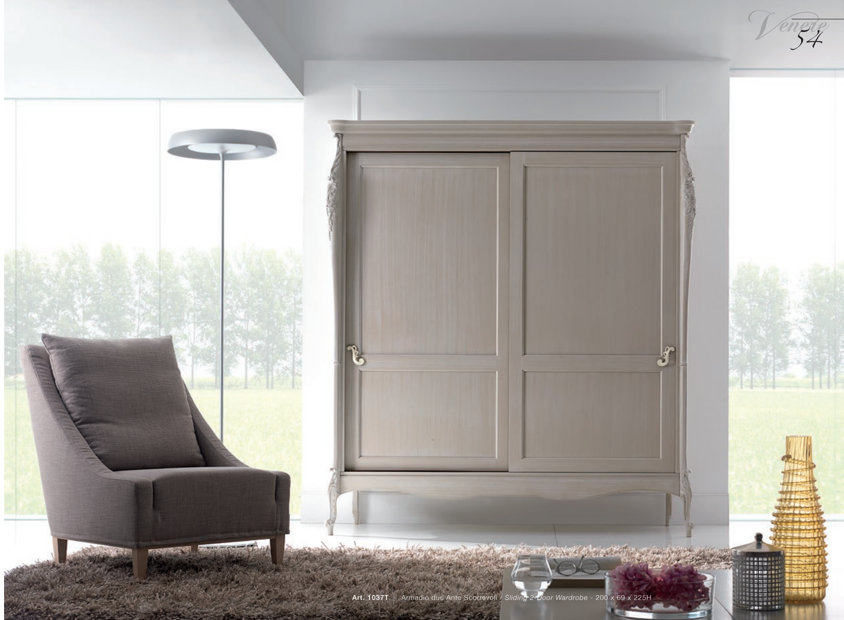
Art. 1037T - Armadio due Ante Scorrevoli / Sliding 2-Door Wardrobe - 200 x 69 x 225H