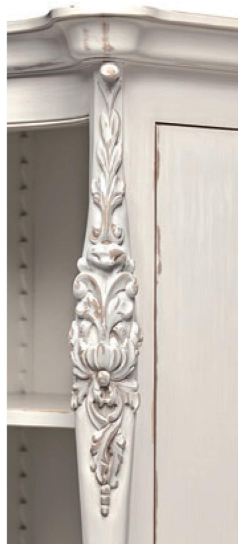
COD. 361 CAT. C GESSO ANTICO DECAPATO