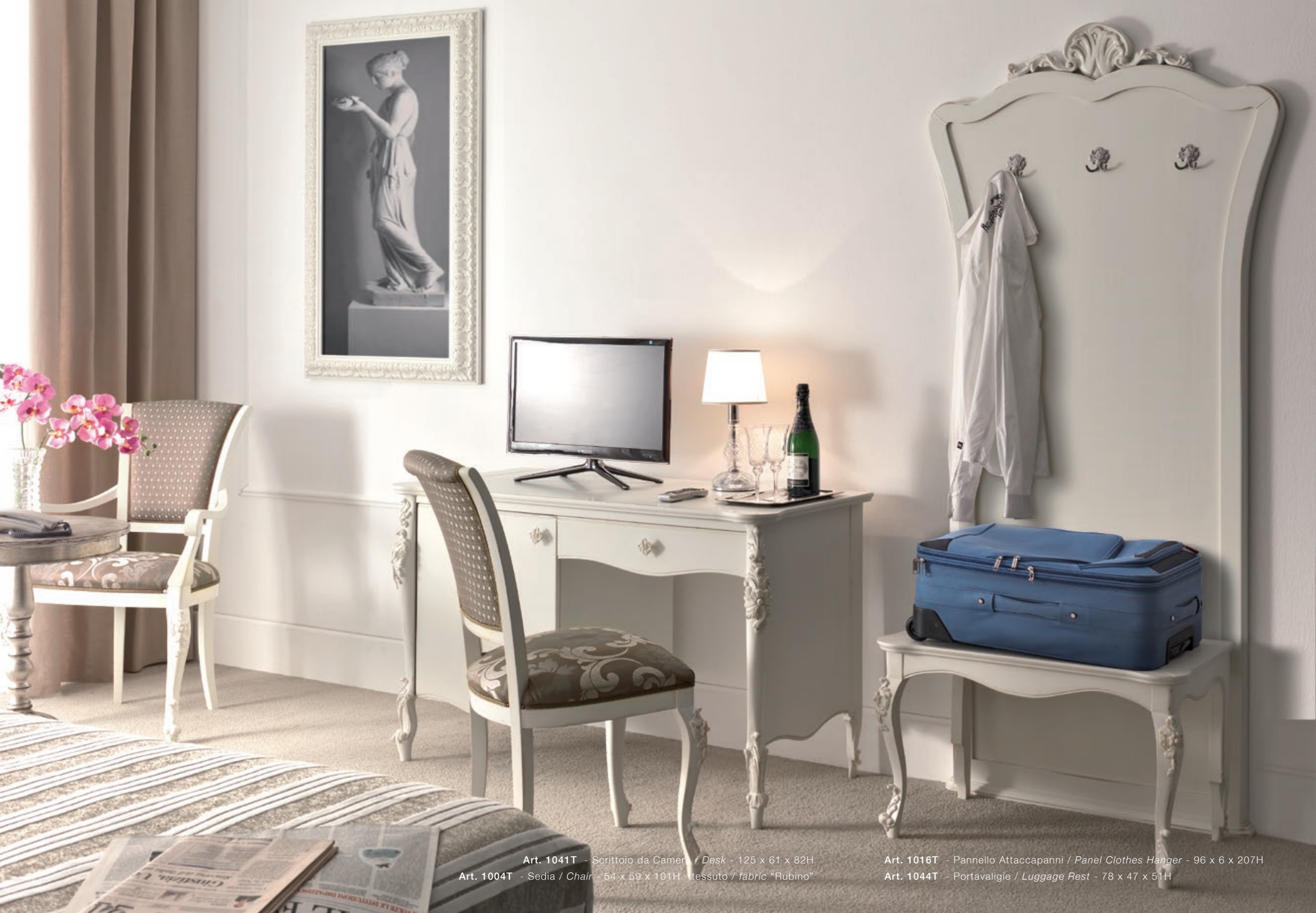
Art. 1041T - Scrivania da Camera / Desk - 125 x 61 x 82H Art. 1004T - Sedia / Chair - 54 x 59 x 101H - tessuto / fabric "Rubino"