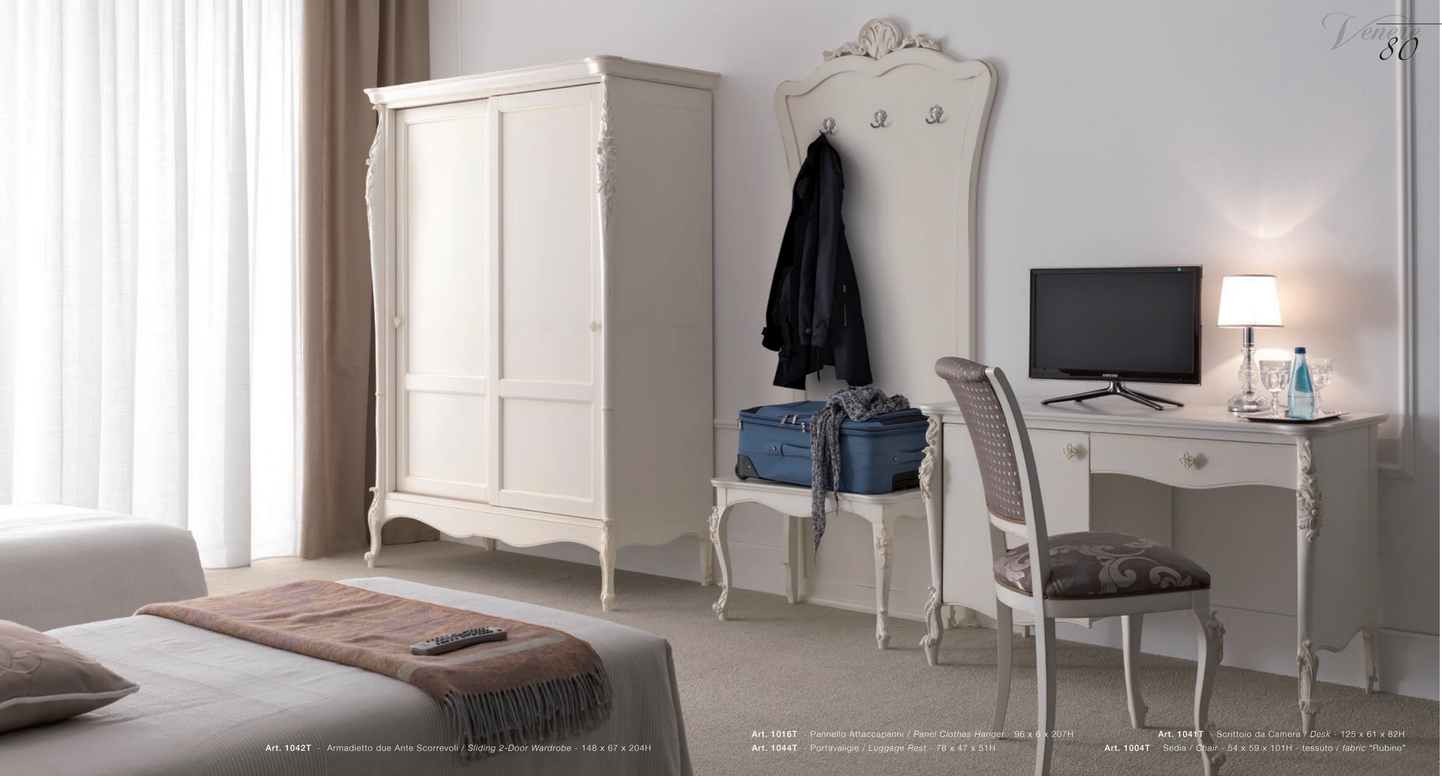
Art. 1042T - Armadietto due Ante Scorrevoli / Sliding 2-Door Wardrobe - 148 x 67 x 204H