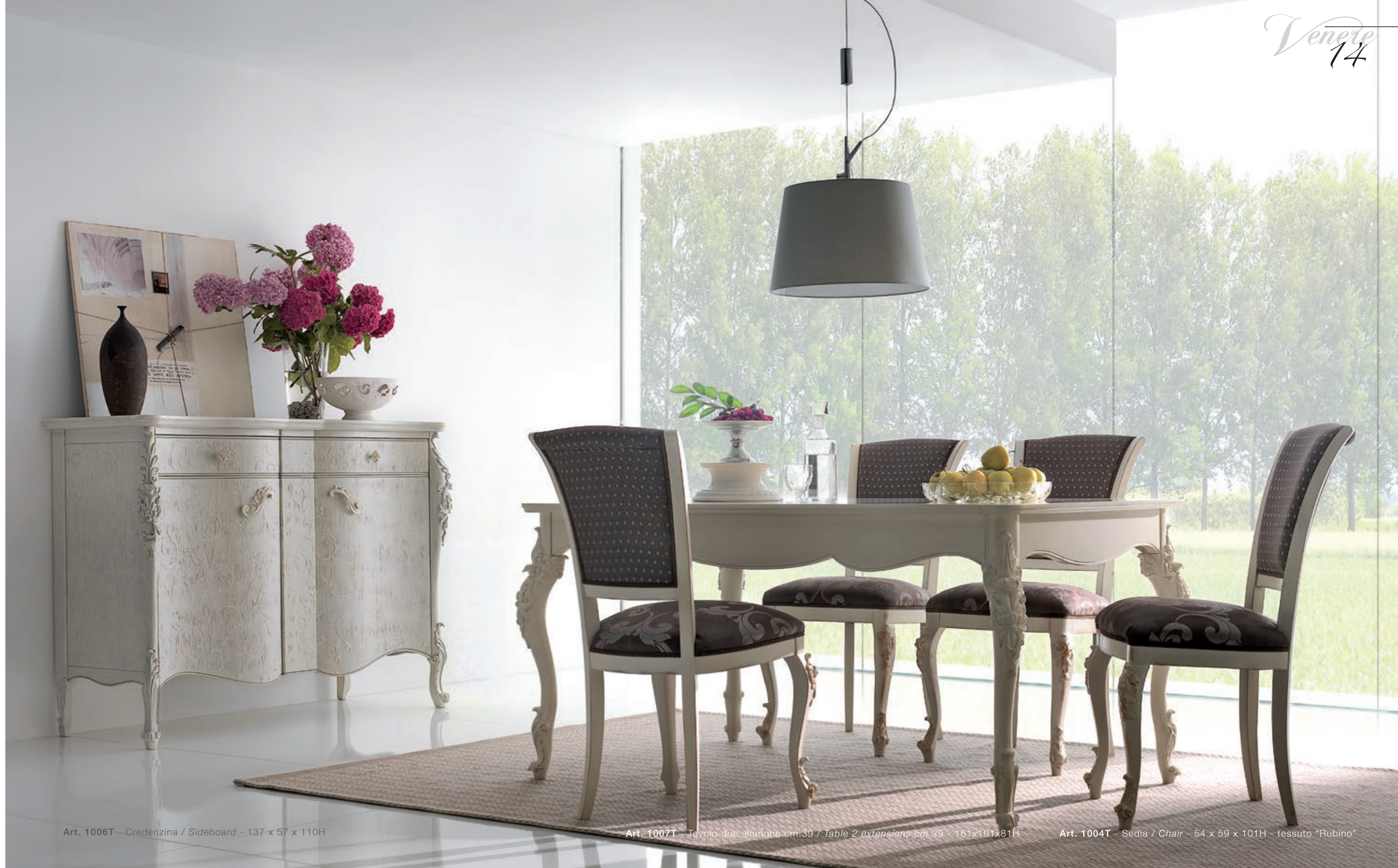
Art. 1006T - Credenzina / Sideboard - 137 x 57 x 110H

Attention to detail and research into new design solutions in the finishes allow these elements to live in inflexible and modern furnishing solutions.