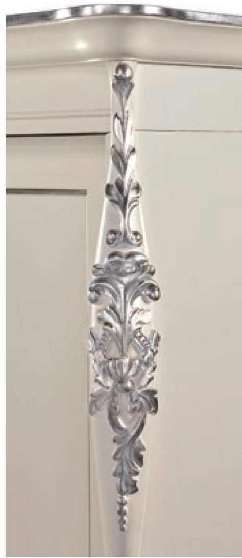
COD. 358 CAT. B+ BURRO DETT. FOGLIA ARGENTO