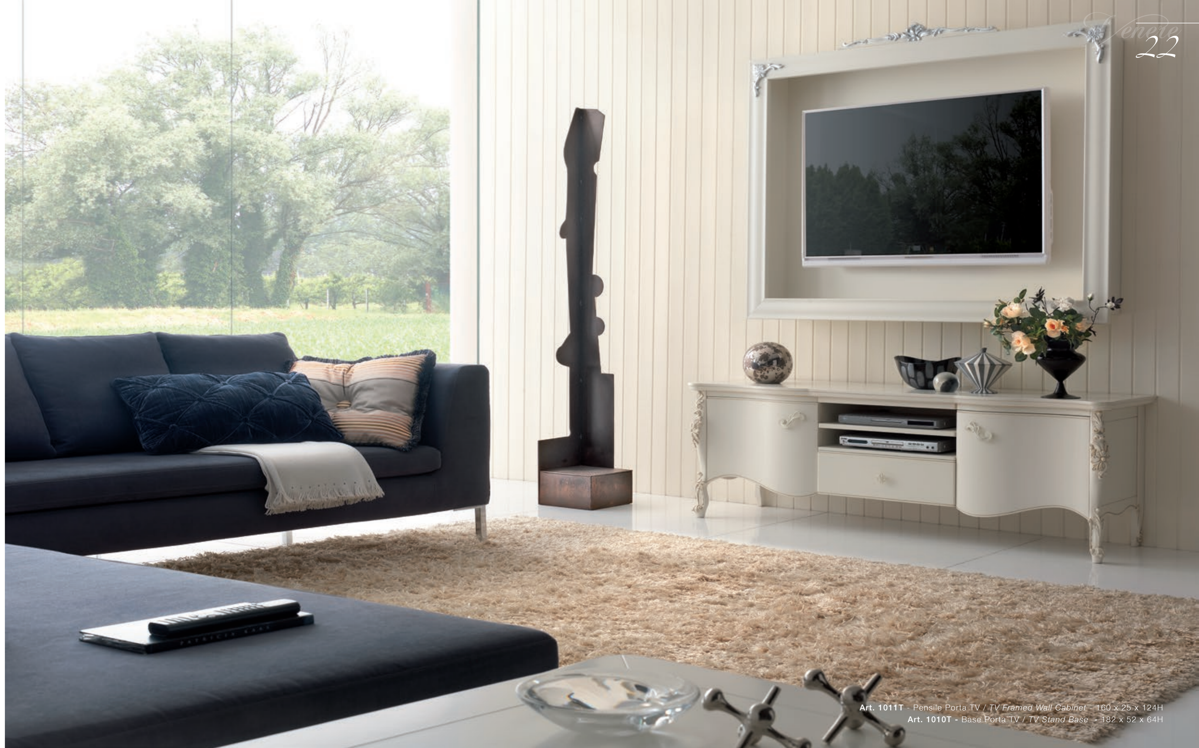
Art. 1011T - Pensile Porta TV / TV Framed Wall Cabinet - 160 x 25 x 124H Art. 1010T - Base Porta TV / TV Stand Base - 182 x 52 x 64H