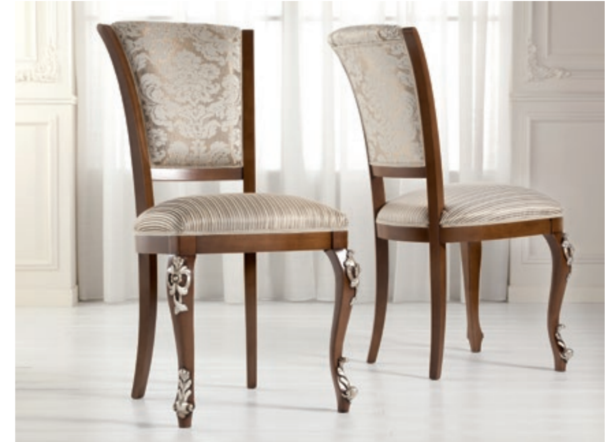
Art. 1004T - Sedia / Chair - 54 x 59 x 101H - tessuto / fabric "Vienna"