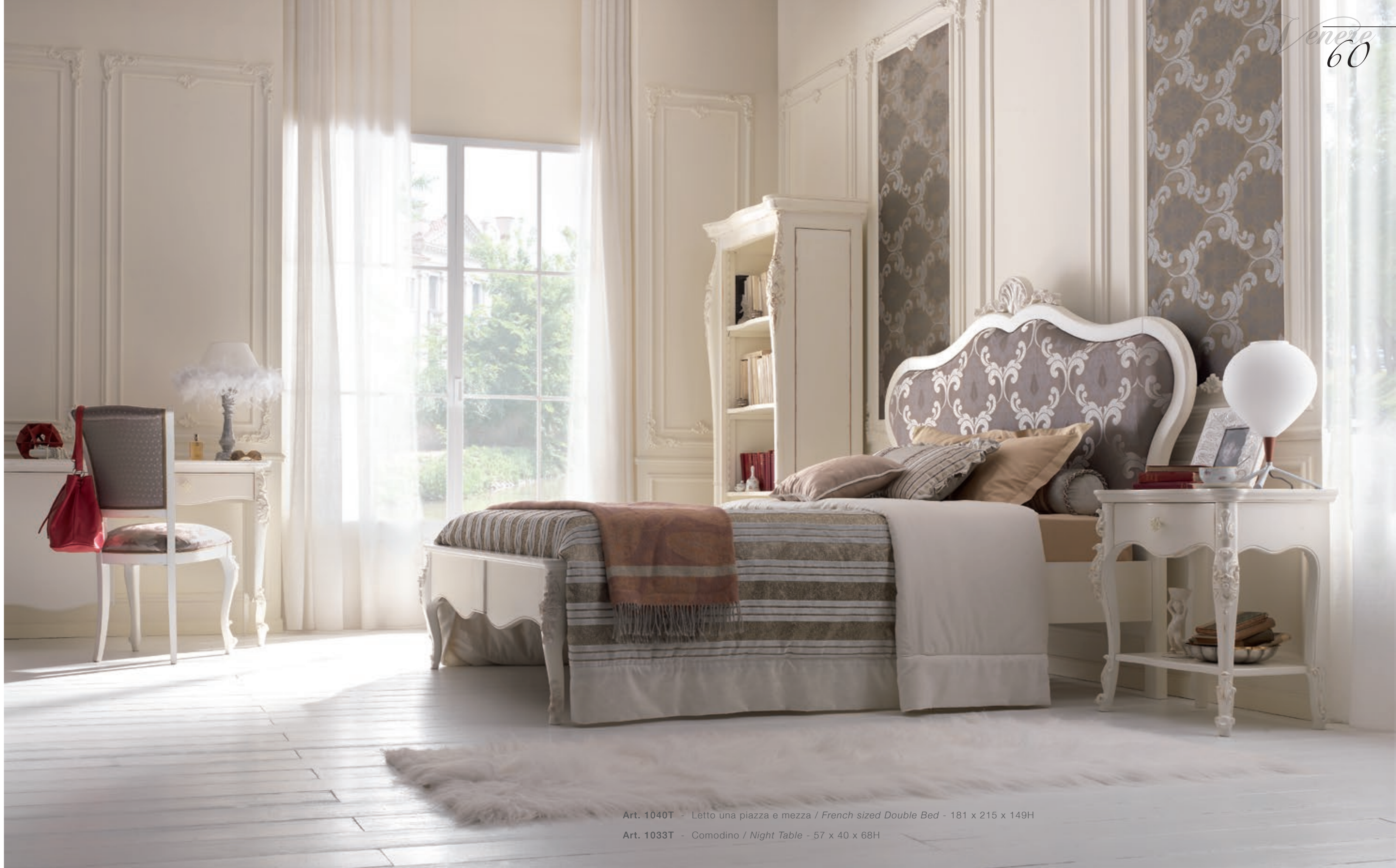
Art. 1040T - Letto una piazza e mezza / French sized Double Bed - 181 x 215 x 149H