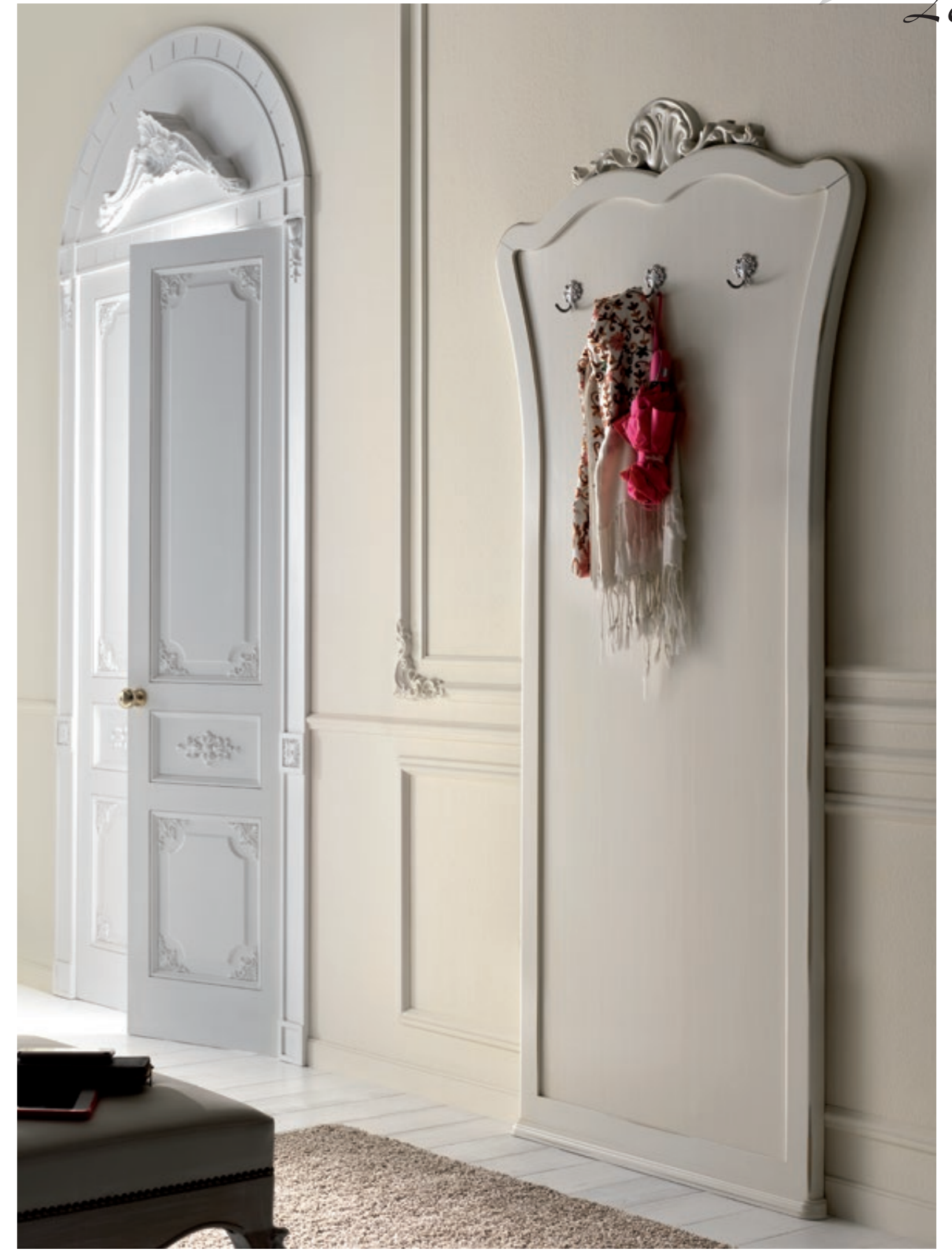
Art. 1016T - Pannello da ingresso / Clothes Hanger Panel - 96 x 6 x 207H