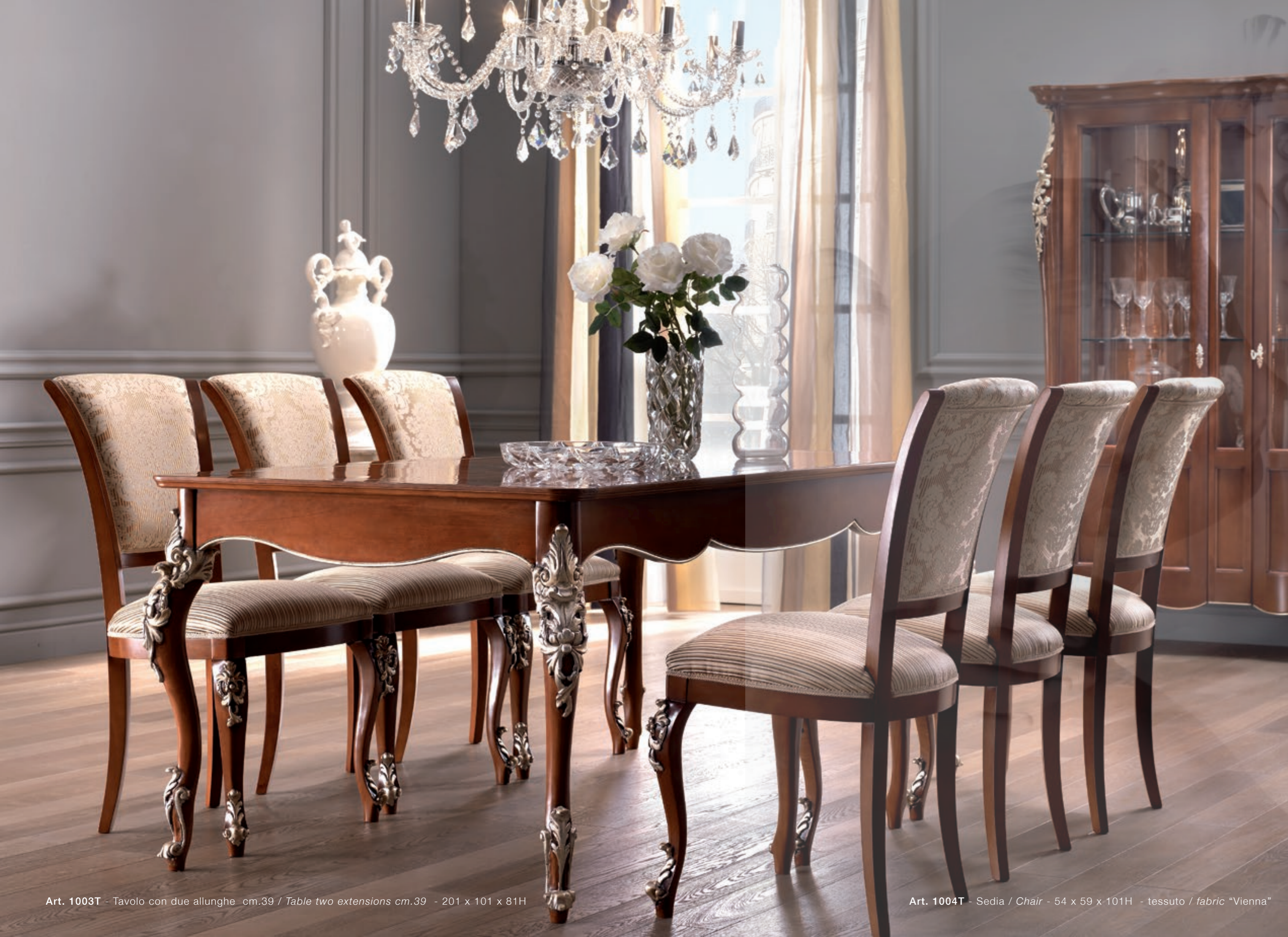
Art. 1003T - Tavolo con due allunghe cm.39 / Table two extensions cm.39 - 201 x 101 x 81H