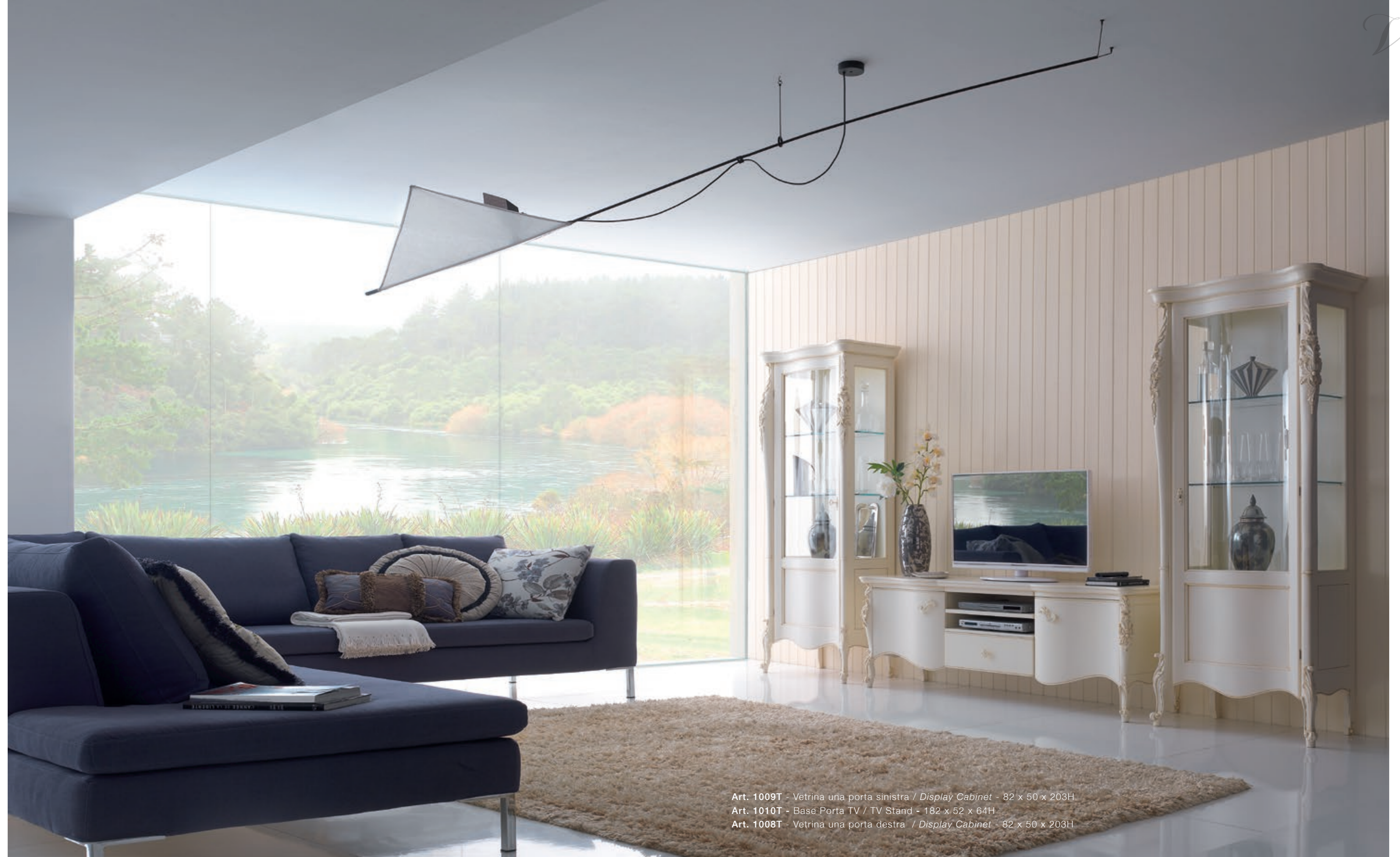
Art. 1009T - Vetrina una porta sinistra / Display Cabinet - 82 x 50 x 203H Art. 1010T - Base Porta TV / TV Stand - 182 x 52 x 64H Art. 1008T - Vetrina una porta destra / Display Cabinet - 82 x 50 x 203H