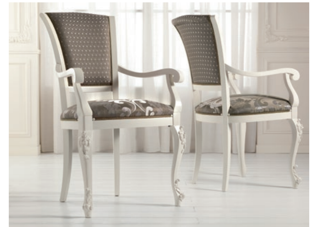
Art. 1005T - Sedia capotavola / Armchair - 64 x 62 x 101H - tessuto / fabric "Rubino"