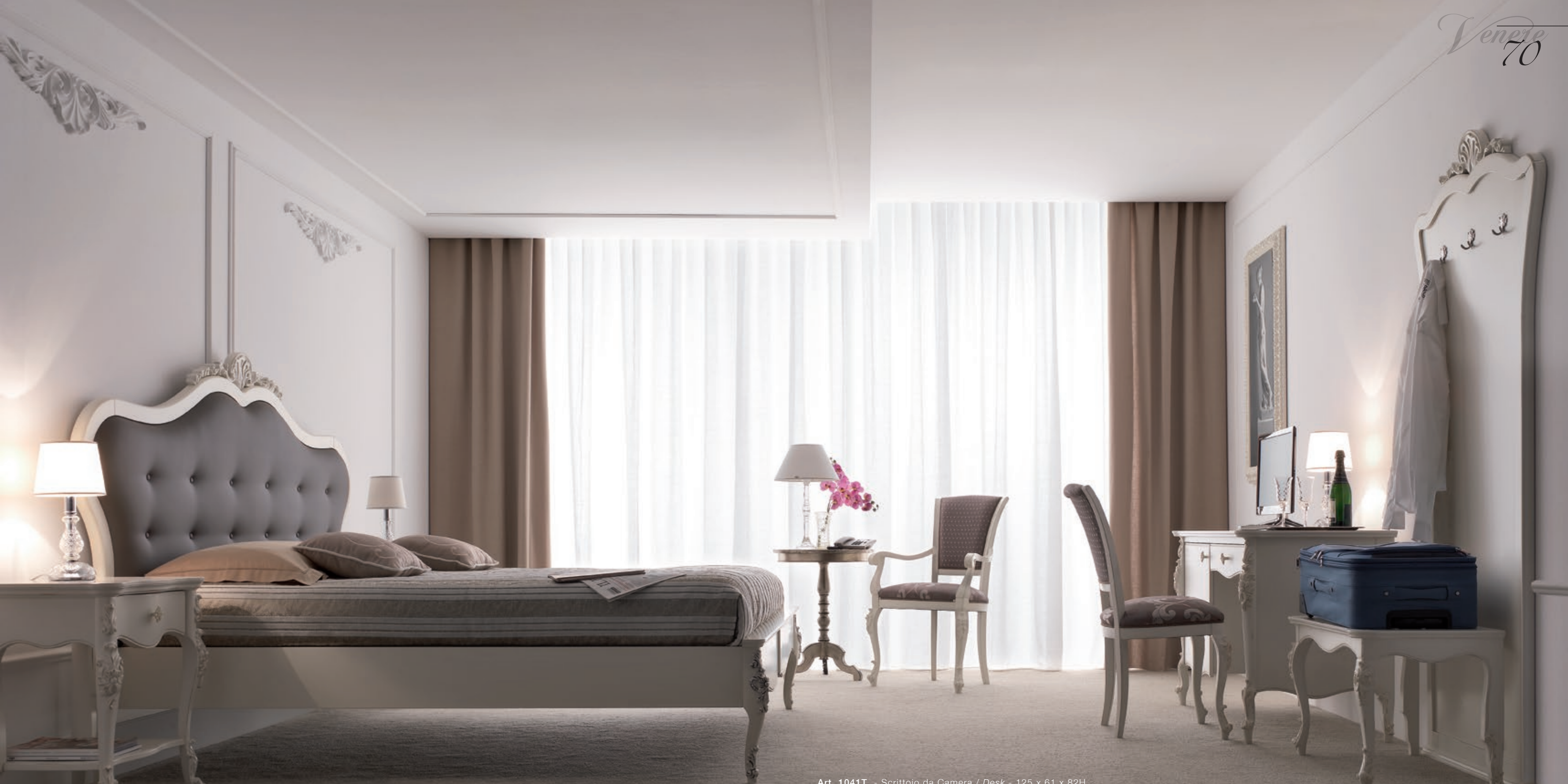
Art. 1033T - Comodino / Night Table - 57 x 40 x 68H