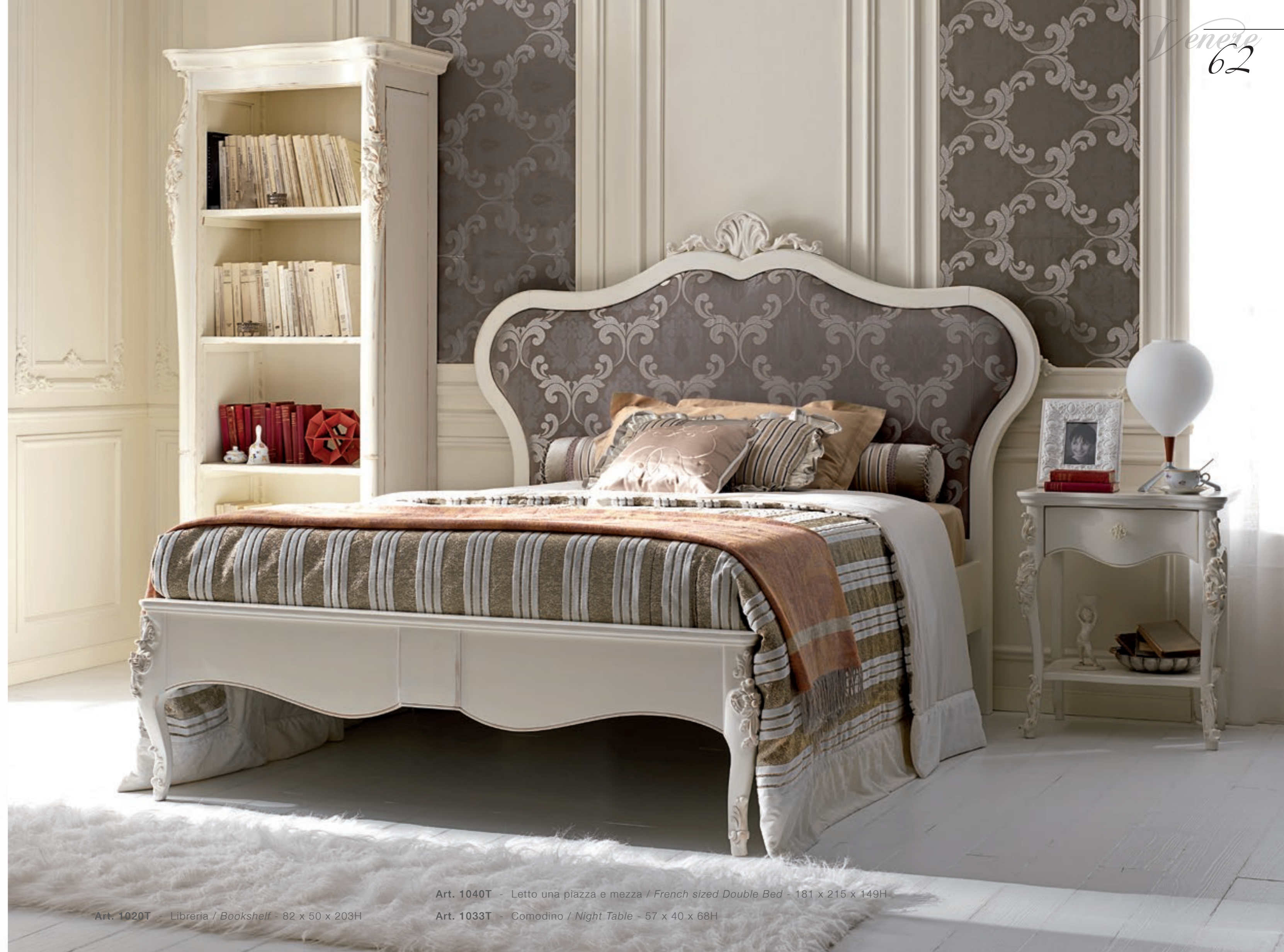
Art. 1020T - Libreria / Bookshelf - 82 x 50 x 203H

Upholstered headboard and decapè finish define a style of furniture that recalls the ancient with understated elegance, in a warm and relaxing atmosphere that makes you feel protected in a tender embrace. The French sized double bed, is more comfortable for a adult or teenager compared to a single bed, and less demanding than a normal double bed.