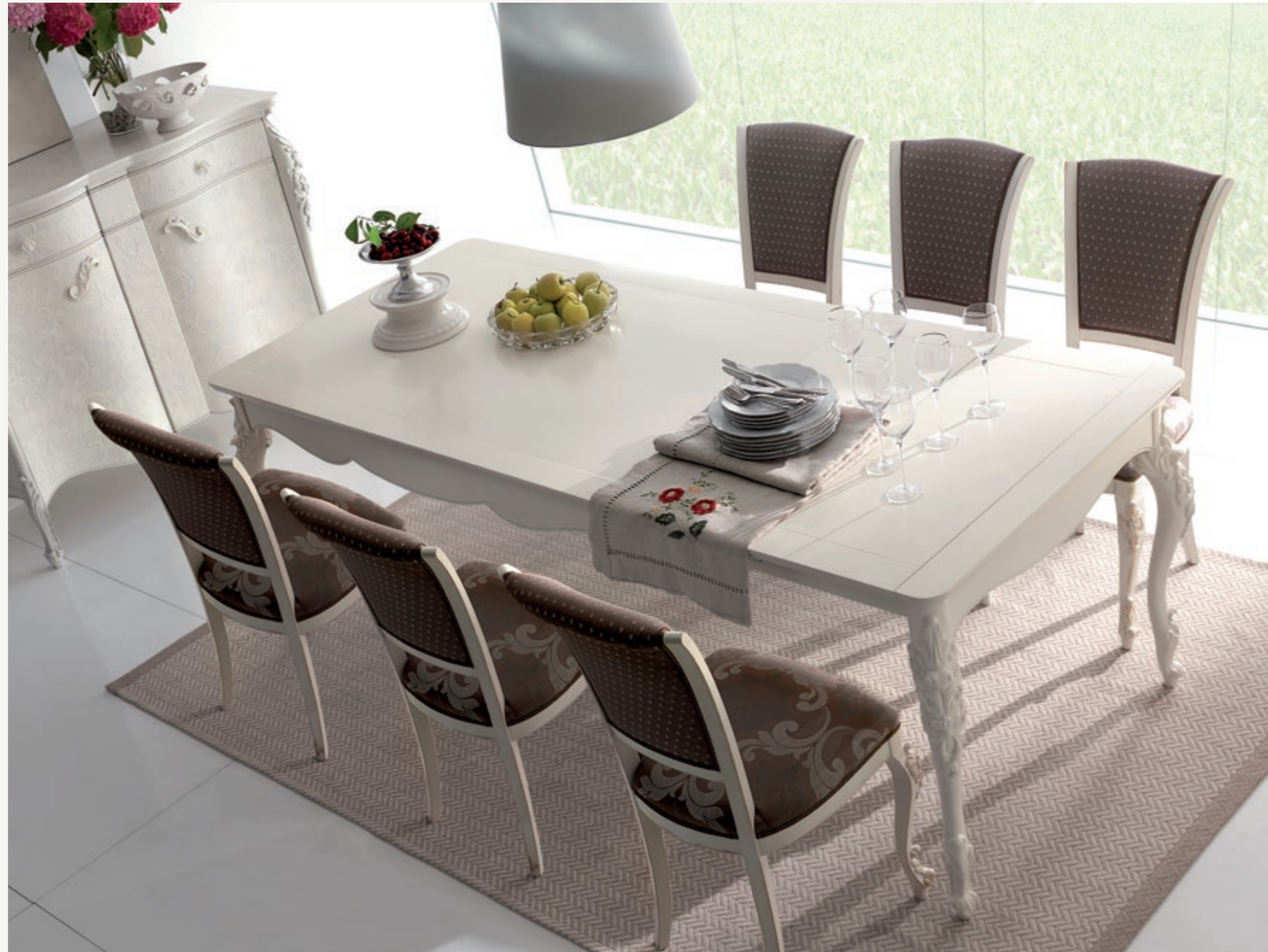
Art. 1007T - Tavolo due allunghe cm.39 / Table 2 extensions cm.39 - 161 x 101 x 81H